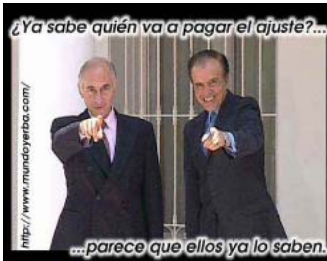
LI 27- marzo 2002

Síntesis: en nuestra opinión vamos a una nueva crisis revolucionaria en el país a corto plazo.