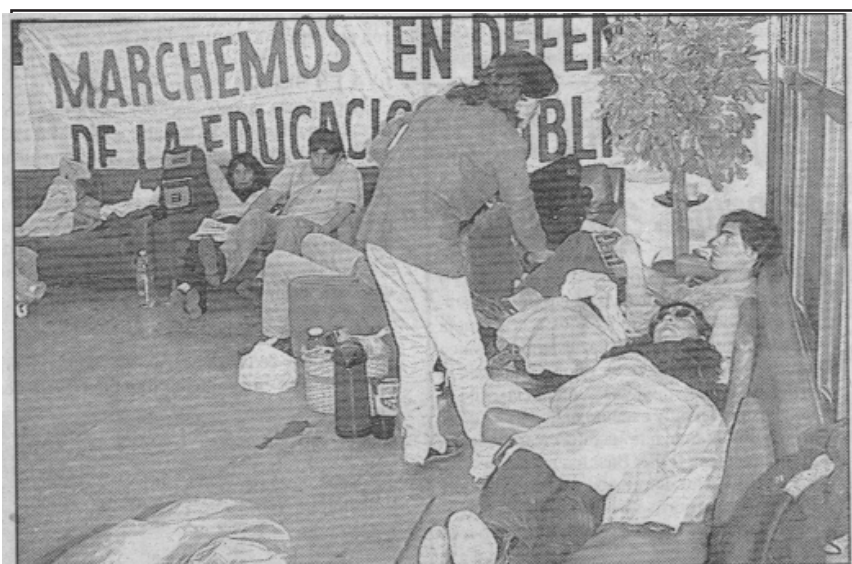
Reciente ocupación de Legislatura provincial por los docentes del chubut

Por lo expuesto exigimos el inmediato esclarecimiento de los hechos enunciados, y desde ya responsabilizamos al gobierno provincial por la integridad física de los luchados de esa provincia.