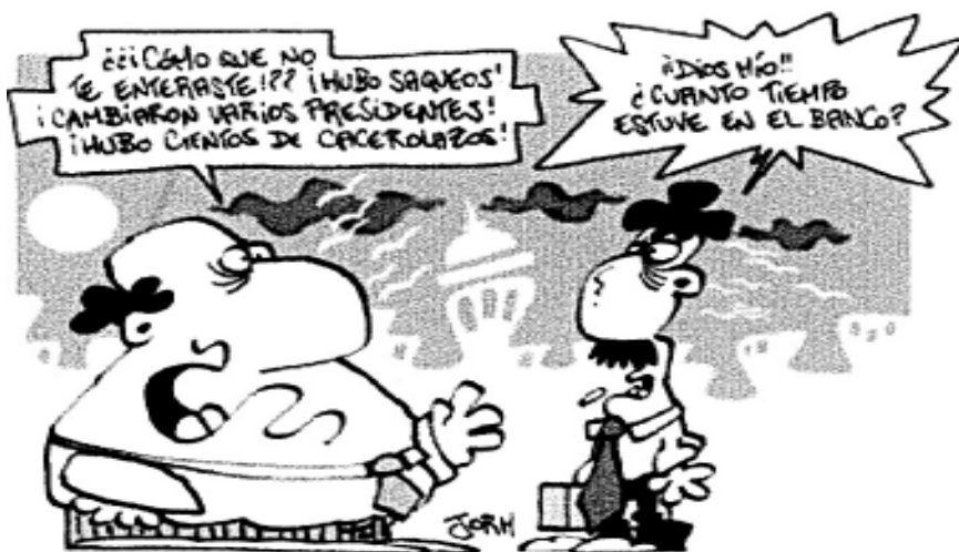
(De Página 12)