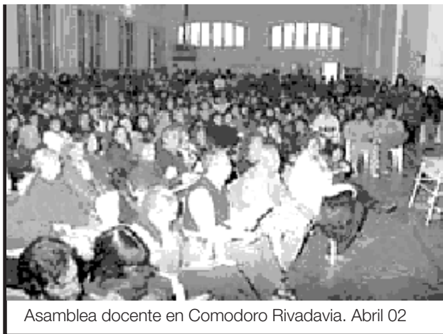
Asamblea docente en Comodoro Rivadavia. Abril 02

CGT de enseñanza y el de Lucha Internacionalista: fueron muy importantes. Las movilizaciones son muy grandes, porque las columnas arrancan del Norte y del Sur y vamos recogiendo gente por el camino hasta llegar al sitio de la concentración. Nos andamos entre 4 y 10 Km. La ministra provincial tuvo que venir a Comodoro el 22. Pero habíamos puesto una condición para negociar nada: que no nos descontaran ni un día de huelga, porque el problema lo crearon ellos y no lo vamos a pagar nosotros. Entramos los 8 nuestros y los dos de ATECH y afuera quedaron como 600 maestros y padres, esperando. Y nos dice que "día no trabajado, día no cobrado". Así que nos fuimos. Agarré el megafono al salir y se los dije a los compañeros: ¡no sabés como se pusieron! Cerramos todas las salidas y dale a los bombos... Y ella dijo que en media hora nos volvía a recibir. Así que ahora entramos además con dos padres: empezó diciendo que no habría descuentos; Aún no tenemos respuesta. En la asamblea de unos 800 que hicimos, se veía de seguir el paro, pero ahí no se podía votar sin mandatos, así