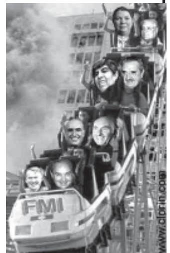
(Algunos políticos argentinos en un viaje de riesgo. Tomado de Claryn, una web satírica)