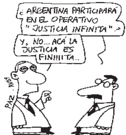
De "Página 12".