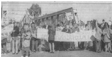
Piquete docente cortando el puente de acceso a Rawson (capital de la provincia). 18/4/02

Al cerrar esta edición, los docentes de la provincia del Chubut siguen en huelga indefinida, a pesar de haber cobrado sus haberes, exigiendo el acondicionamiento de las escuelas que garantice la seguridad, higiene y material para los alumnos.