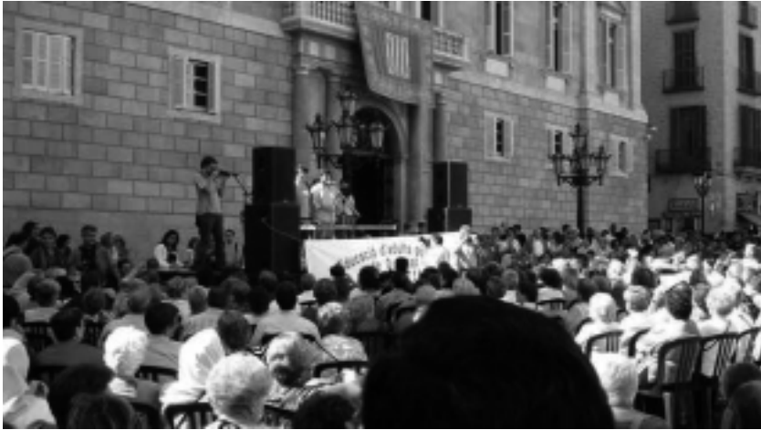
Manifestación de escuelas de adultos, el curso pasado

petencias de los Departamentos implicados.