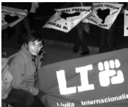
Banderas de LI en Vitoria