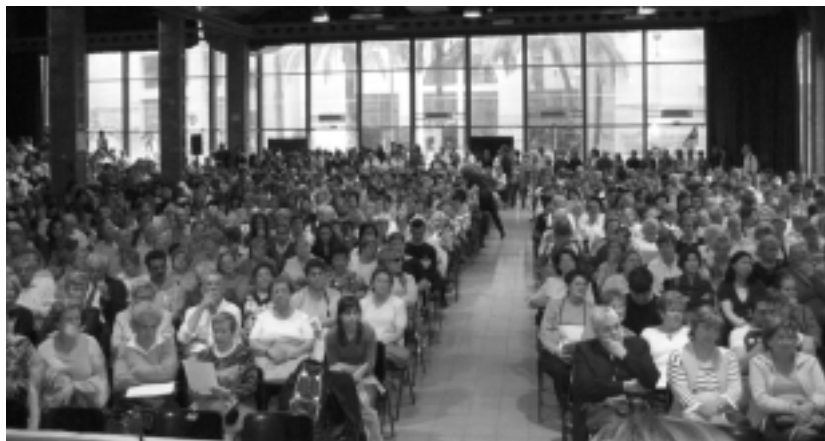
Acto en Barcelona el 4 de mayo

La Mesa de la Educación de personas adultas de Catalunya, plantea con su propuesta y ha recogido en el manifiesto los puntos básicos en que se debería de basar la ley de Educación Permanente anunciada por la Consejería de Educación: