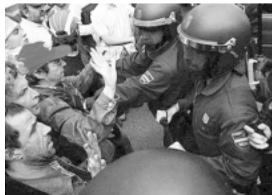
La policía cargó contra los trabajadores en la Estación de Vigo

vi. El chaval se puso a correr y la furgoneta, en vez de frenar, aún aceleró más y el golpe fue impresionante, encima que le dieron con el parabrisas, encima después le pasó una rueda por la pierna. El conductor debía de estar encantado. Como mínimo hacer una manifestación para pedir la dimisión de ese señor que es una marioneta del gobierno español del PSOE. Como se cantaba “PSOE, PP, a mesma merda é”. Ese golpe de autoridad sirvió para que la ciudadanía de Vigo viese, al contrario de lo que decían los medios de comunicación de que éramos unos animalitos, que de verdad estamos