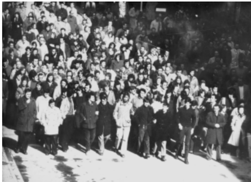
Milers de joves i treballadors van participar al funeral en record dels companys assassinats

El 3 de març de 1976, cinc treballadors van ser assassinats per i 200 van ser ferits de bala. Fraga i altres responsables polítics del franquisme van ordenar a la policia disparar a boca de canó per dissoldre una assemblea a l'església de San Francisco, a Gasteiz, en plena vaga general. Va ser un dels moments més significatius de l'anomenada "Transició". El pacte de silenci que es va imposar aleshores ha arribat fins avui. Cap responsable ha estat jutjat pels fets i s'ha volgut sotmetre les víctimes a l'oblit. Reproduïm l'article d'un company que recorda els fets i segueix en la lluita pels drets dels pobles i dels treballadors.