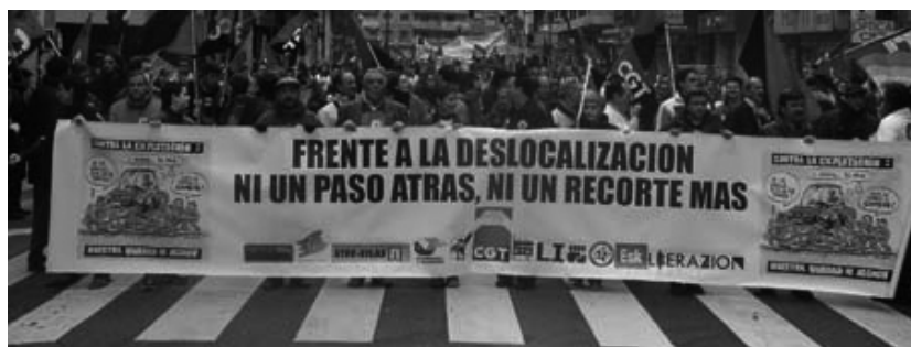
Manifestació a Saragossa del sector de l'automoció, impulsada per CGT

blema dels límits de la lluita sindical", ja que, ¿com construir el partit que defensi els interessos de la classe obrera sense una lluita conseqüent a les fàbriques? Els crítics de CCOO estan en un cercle viciós que només pot trencar-se amb la defensa dels llocs de treball fins al final, dels mètodes de lluita obrera (vagues i assemblees decisòries) i fonamentalment amb la lluita per revocar dels seus llocs de direcció als sindicalistes burocratitzats i la seva substitució per lluitadors, com per exemple està fent el Corrent d'opinió a la comarcal de Girona. El problema de Seat no és que els crítics "només" agrupessin el 47% en CCOO o que fos una lluita en solitari, sinó que es va limitar la lluita dels seus treballadors implicant a la indústria auxiliar i a d'altres fàbriques que s'unissin a la mateixa. El drama de Seat no ha estat fora de la