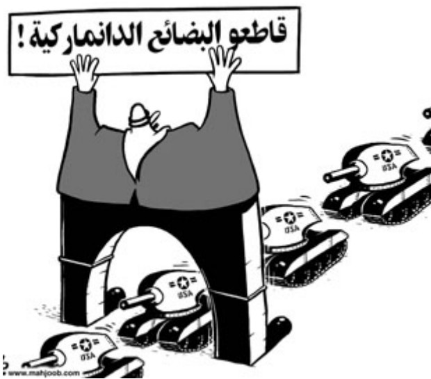
Els Governos àrabs mobilitzen contra les caricatures i no contra els tancs de l'imperialisme

Per descomptat que no podem permetre qualsevol limitació sobre la llibertat d'expressió, una llibertat que a Europa es va guanyar al preu de la sang de la classe obrera; avui està costant el mateix per als pobles musulmans en la seva lluita contra els seus propis governs dictatorials i col·laboradors de l'imperialisme. No obstant això, presentar el conflicte sobre els dibuixos com un si o no a la llibertat d'expressió és la falsedat que voldria fomentar l'imperialisme. La llibertat d'expressió no és insultar les minories oprimides per raó de sexe, raça o religió, sinó comptar amb una sèrie de garanties per a protegir-se en la mesura del possible de les represàlies que pren el poder quan se'l qüestiona. I la publicació de les caricatures a Dinamarca no té res a veure amb això. Però