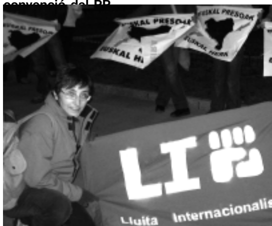
Banderes de LI a Vitoria