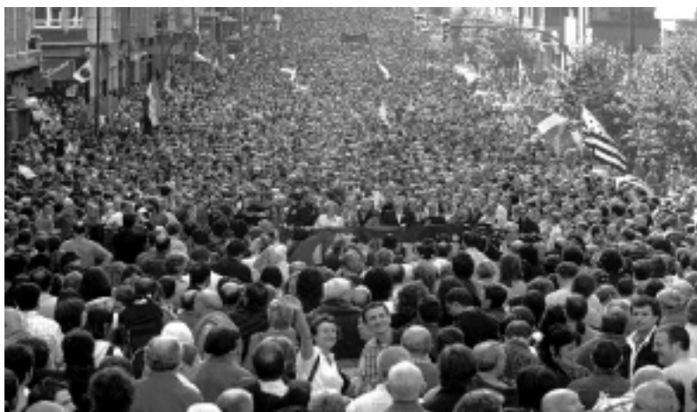
Vuitanta mil manifestants a Bilbo, l'u d'abril

el dels acords del Divendres Sant d'Irlanda i el d'Oslo palestí. Les imatges de Jerry Adams dirigent del Sinn Fein i Arafat dirigent de la OLP, van figurar en els cartells de HB com a referents de negociacions. Fins i tot avui la referència d'Irlanda està viva i es presenta al reverend Alec Reid, mediador d'aquest conflicte, com protagonista especial d'entrevistes i actes en l'actual procés basc. En ambdós casos de negociacions de pau, els processos oberts van