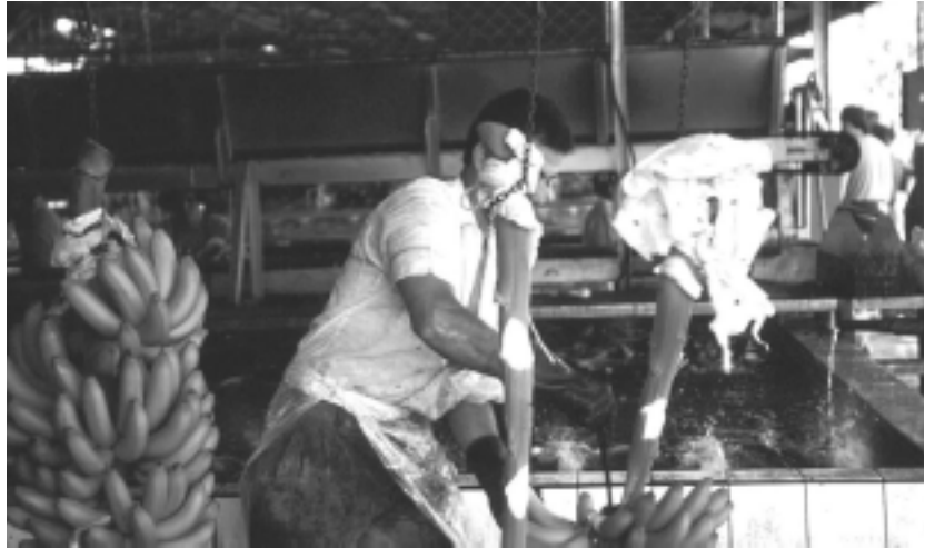
Plantació bananera a Costa Rica

per a tots els qui lluitem pels pobres d'aquest país". D'altra banda, el que passa a Costa Rica es repeteix en el conjunt de Llatinoamèrica amb un creixement constant de la persecució a lluitadors en el que s'ha anomenat "criminalització de la protesta social".