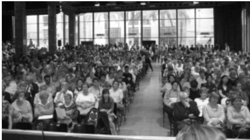
Acte a Barcelona el 4 de maig

La Mesa de l'Educació d'Adults de Catalunya, planteja en la seva proposta, i així es recull en el Manifest, els punts bàsics en els quals s'hauria de basar la llei d'Educació Permanent anunciada per la Conselleria d'Educació: