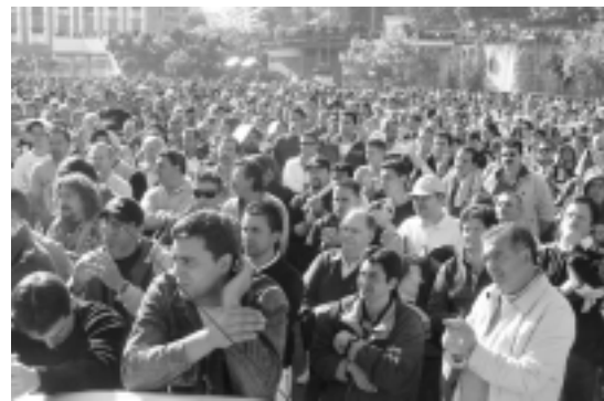
Assemblea a la Praça del Rei

Sí. A més de la desmesurada càrrega, va haver-hi companys que van ser maltractats en ser detinguts, a les furgonetes. Ens van tenir tota la nit incomunicats i sense menjar. Més d'un company és quedarà sense pràcticament el 90% de visió i a un altre el van atropellar sense pietat. Jo ho vaig veure: el xaval es va posar a córrer i la furgoneta, en comptes de frenar, encara va accelerar més i el cop va ser impressionant, a més de colpejar-lo amb el parabrisa, li van passar una roda per la cama.