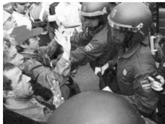
La policia va carregar contra els treballadors a l'estació de Vigo

Aquest cop de força va servir perquè la ciutadania de Vigo veiés, al contrari del que deien els mitjans de comunicació que érem unes bestioles, que de debò estem lluitant pel pa dels nostres fills i vénen aquests policies, de fora de Galiza, a fotre canya als obrers de Vigo que van aixecar la ciutat. Autèn-