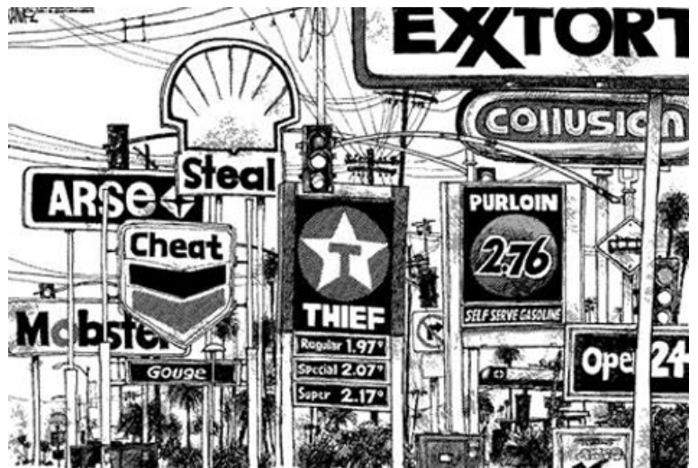
Extorsió, robo, ataca, estafa, hurto