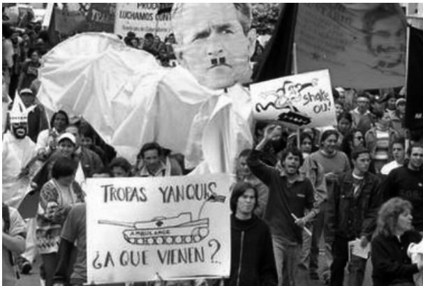
Manifestació a Asunción contra la base d'EEUU,

Comitè Executiu Partit dels Treballadors - PT Asunción, 7 de juny de 2006.