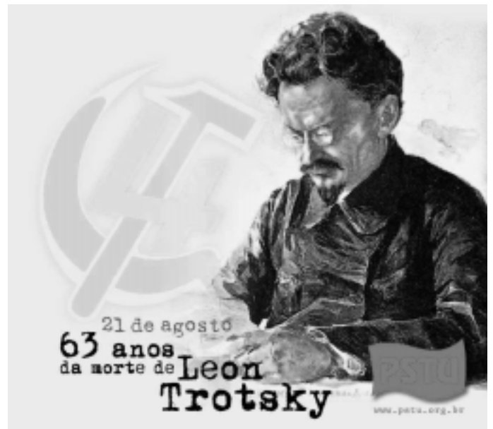
Cartell del PSTU de 2003

I ho va dir en un temps en el qual es considerava que Stalin era el gran anticapitalista. Per raons que excedeixen les possibilitats d'aquest espai, no podem explicar tots els motius pels quals no es va complir la condició per a impedir la restauració. Però no va ser per no haver lluitat. I els resultats estan a la vista: el capitalisme ha estat