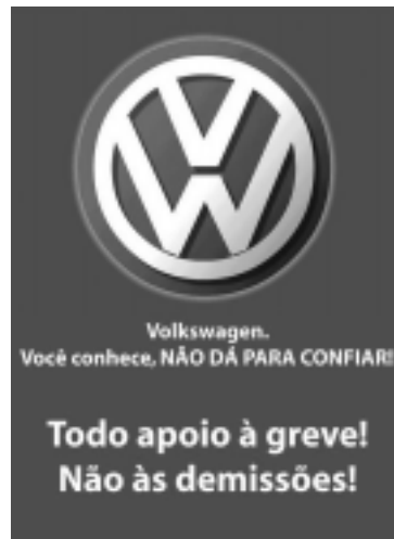
Enganxina de Conlutas

El dilluns 4, en una tarda freda i nuvolosa, els treballadors de la Volks van escoltar la proposta de suspensió dels acomiadaments i el retorn a les negociacions. Els treballadors desconfien molt de la direcció del sindicat. Fins i tot amb la suspensió, prop del 15% dels metal·lúrgics van votar contra la proposta de reprendre el treball. L'empresa encara té com objectiu acomiadar gent. Una nota del director executiu de Relacions Laborals de la Volks de Brasil confirma aquesta intenció: "La Volkswagen reafirma la necessitat d'adequar la seva planta de personal en 3.600 persones en els pròxims anys, no obstant això, està oberta per a discutir les condicions per a la seva realització".