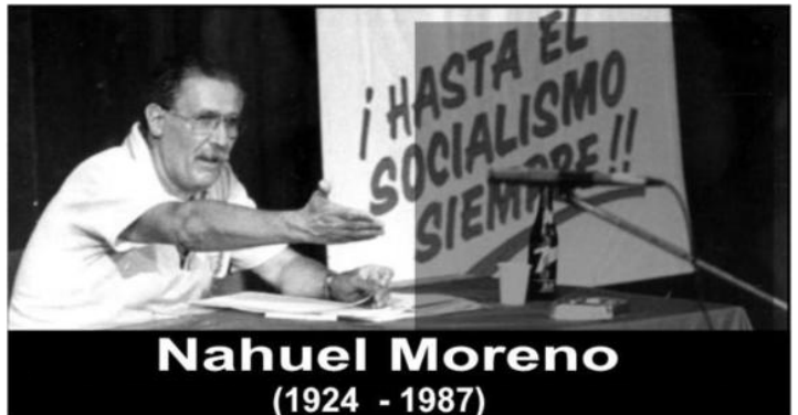
Nahuel Moreno (1924 - 1987)

Així començava el suplement que vam dedicar a Moreno fa ara cinc anys, que tornem a reproduir i que podeu trobar en la nostra web: http://luchainternacionalista.org/ . No obstant això el major homenatge que podem fer-li és, com dèiem llavors, estar amb les lluites i persistir en la tasca de construir partits revolucionaris i reconstruir la IV Internacional