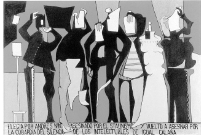
Elegia per Andrés Nin, 1991

(Fundación Granell: http://www.fundacion-granell.org )