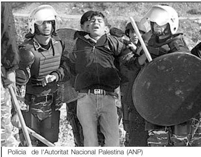
Policia de l'Autoritat Nacional Palestina (ANP)

per l'exèrcit sionista a diari, segrestos i assassinats selectius... fins arribar al del número dos de Hamas: Mahmud Abu Hanud, en els funerals del qual es van realitzar promeses de venjança amb atemptats suïcides. Les van complir: van ser decenes les víctimes israelianes. I Sharon, envaletonat, ha emprat exactament els mateixos mètodes que EEUU a l'Afganistan: bombardejos "contra el terrorisme".