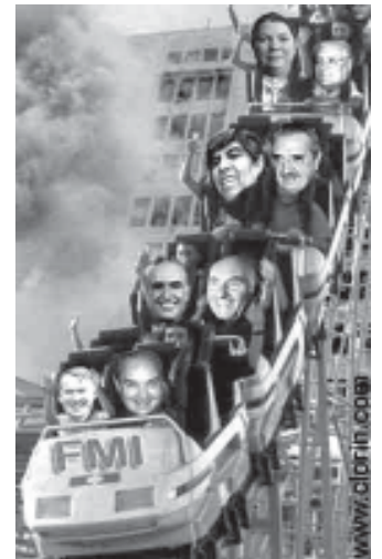
(Alguns polítics argentins en un viatge de risc. Baixat de Claryn, un web satíric)