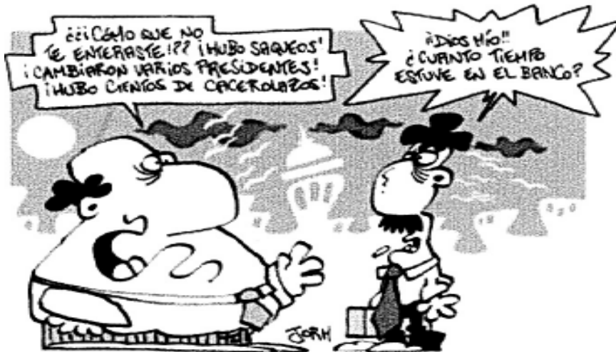
(De Páginia 12)