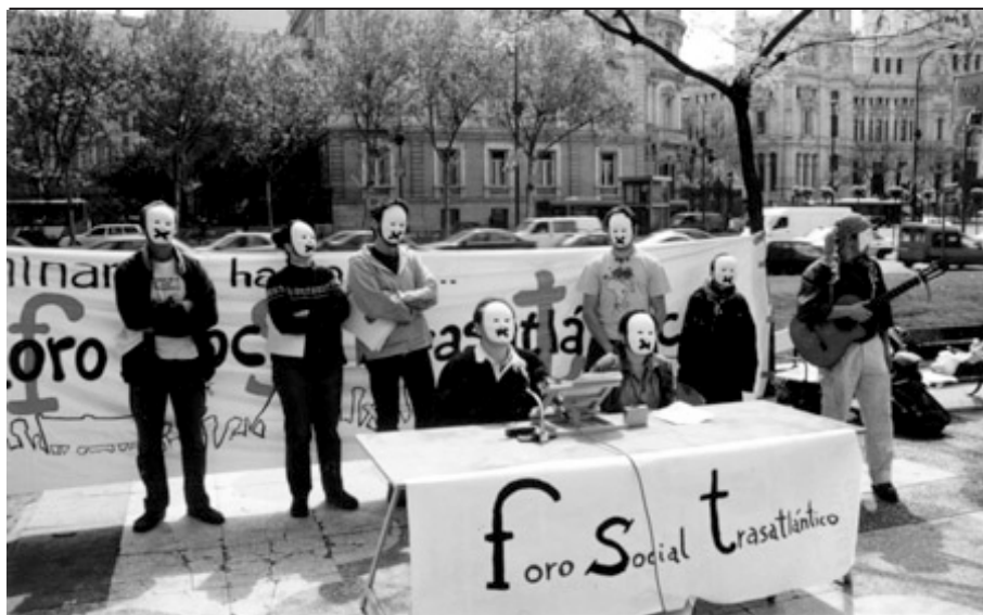
Presentació del FST a Madrid. En defensa de les llibertats

il·legal dels pres@s vasc@s, repressió dels moviments populars, atemptats) converteixen el projecte d'il·legalització en un acte més de manipulació de l'opinió pública i segrest de la sobirania popular.