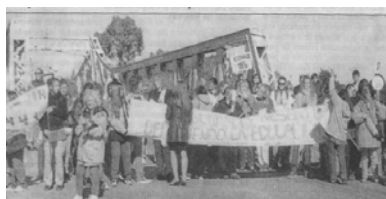
Piquet docent tallant el pont d'accés a Rawson (capital de la província). 18/4/02

En tancar aquesta edició, els docents de la província del Chubut segueixen en vaga indefinida, tot i haver cobrat el que se'ls devia, exigint el condicionament de les escoles que garanteixi la seguretat, higiene i material per als alumnes.