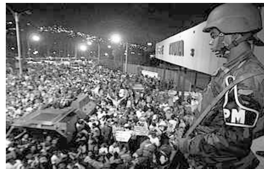
Mobilització a la base de Tiuna, on estava detingut Chávez

I com a símbol la marxa que anirà a Miraflores i iniciarà el cop, arrenca d'una de les seus de PDVSA a Caracas. Els