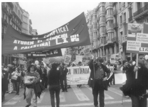
Barcelona, 14/4/02. A la mani vam ser 30.000