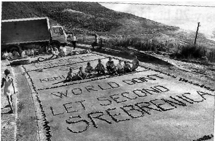
Albano-kosovars barren el pas a les KFOR russes

El juny d'enguany, després d'anys d'opressió i repressió sota la bota del règim serbi, els kosovars van veure com es retiraven la policia, l'exèrcit i els paramilitars txètnics de la major part de Kosova. D'aquesta manera es posava fi a un règim d'apartheid i de neteja ètnica contra el qual les organitzacions kosovars lluitaven des de la clandestinitat en condicions duríssimes. Però mentre els txètnics es retiraven, de manera coordinada (per evitar una situació de "buit de poder", és a dir, d'independència de fet) començava l'ocupació militar del país per tropes de l'OTAN. Després d'haver bombardejat massivament Kosova i Iugoslàvia, assassinant milers d'innocents i destruint totalment el teixit econòmic, però sense haver aturat una neteja ètnica que continuava impunement, sota els avions, casa per casa, provocant les atrocitats més salvatges, les tropes d'Occident i de Rússia entraven triomfants a Kosova.