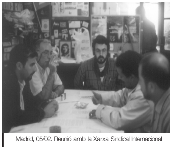
Madrid, 05/02. Reunió amb la Xarxa Sindical Internacional

AV- Va ser per la militància que vaig veure i la claredat quan vam entrar junts en el tema de la immigració: estàvem sols. Amb posicions molt de classe, políticament molt sèries. (...) I a més que no es quedava només en una cosa puntual, sinó que transcendia. Jo sóc sindicalista i miro les posicions polítiques, perquè les crec necessàries, sempre i quan siguin reals, enganxades al terreny, i que parteixin de que cada derrota és una derrota i hi cal lluitar per que no n'hi hagi ni una. No és veritat que "de derrota en derrota fins la victòria final", no, tot el contrari: de victòria petita en victòria petita fins la victòria final. I en aquest terreny, l'activitat vostra en el terreny sindical, en el terreny polític, en l'internacional, és la que ens fa falta. No sóc dels que diuen que els partits polítics en els sindicats sobren: sobren si fan de corretja de transmissió, sobren si és per a imposar a fulanet o menganet –i això sigui partit polític o ateneu