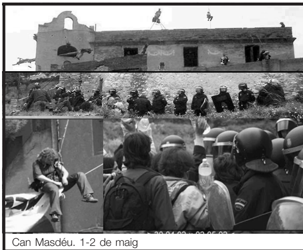
Can Masdéu. 1-2 de maig

ajudat. Abans d'okupar vam fer una reunió amb la Coordinadora d'Associacions de Veïns i entitats del barri. També estem formant part de la creació de la Plataforma Cívica per a la Conservació de Collserola i tenim contacte amb la FAVB. Però sobretot ha estat el contacte amb la gent: pugen els jubilats, parelles amb nens, que han simpatitzat