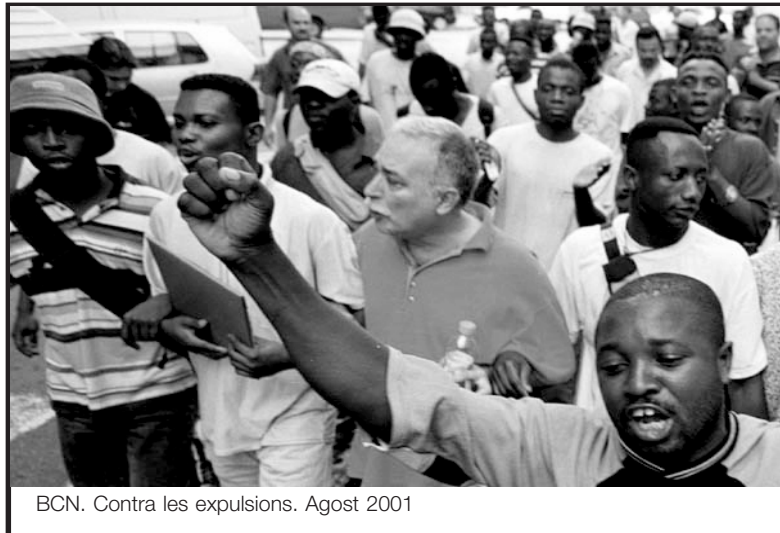
BCN. Contra les expulsions. Agost 2001

AV- A la SEAT jo ja tenia, òbviament, molts problemes... i