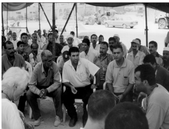
Trobada amb els aturats de Yan Kunis (Gaza)

colonització en forma d'assentaments i carreteres d'ús exclusiu per als colons, el control de l'aigua i de la producció agrària, el confinament de la població palestina en bantustans aïllats i vulnerables, l'ofegament econòmic dels territoris ocupats,