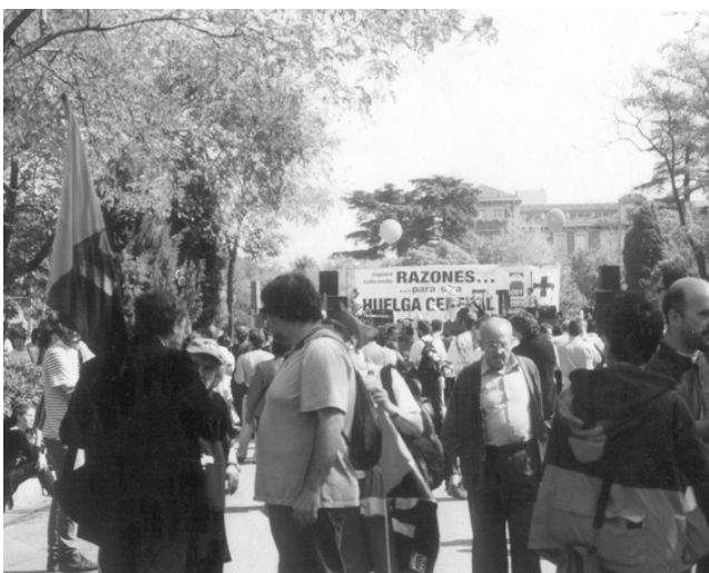
Acte de CGT. 5 d'octubre. Madrid

En qualsevol cas, l’actitud de l’actual direcció de CGT la porta a acabar seguint de mala gana les mobilitzacions de la gran majoria de la classe obrera com la vaga general del 20 de juny o participant a última hora i a desgrat a la manifestació de Madrid del 5 d’octubre. En lloc d’ampliar les mobilitzacions, de buscar elements comuns, d’atacar al nivell més unitari l’ofensiva global del capital, s’opta pel corporatiu, el parcial. Aquesta opció, amb l’excusa fàcil que “els majoritaris ens traïran”, els deixa les mans lliures per a “gestionar” la contestació dels treballadors. D’aquesta manera s’ignora que encara que no ens agradi la burocràcia sindical té una capacitat de convocatòria perquè sap que la unitat d’acció és essencial en la mobilització dels treballadors.