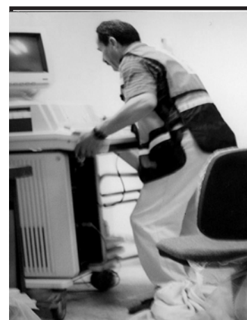
Clínica dels Comitès de Treballadors de la Salut. Nablús. Destrossada per l'exèrcit israelià el passat 28 d'agost.