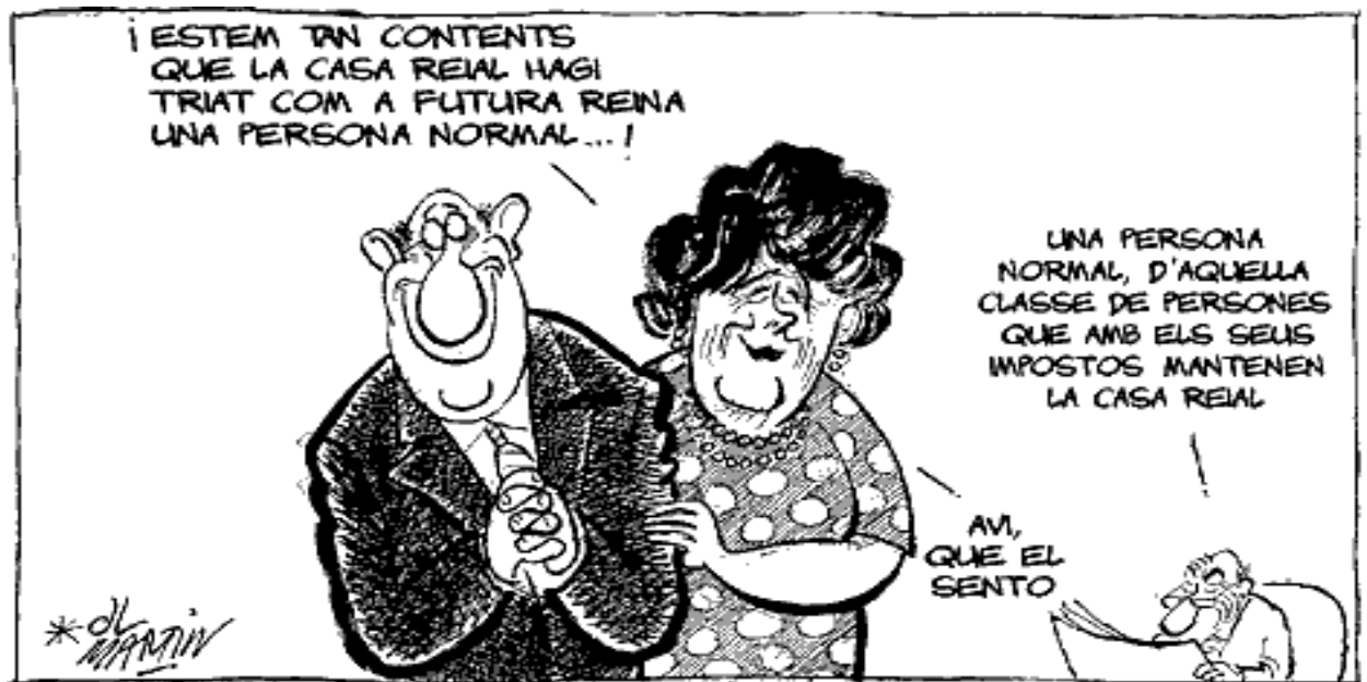
Kap a La Vanguardia