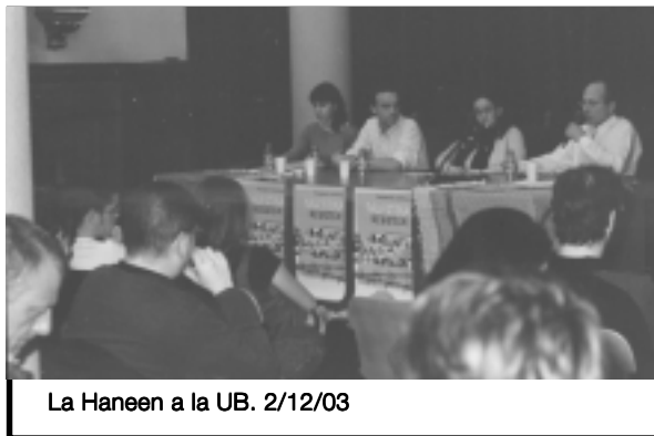
La Haneen a la UB. 2/12/03

H: Mira, quan Lionel Jospin va venir a la Universitat i va començar a fer el típic discurs d'acceptar la conformació de dos estats -cosa