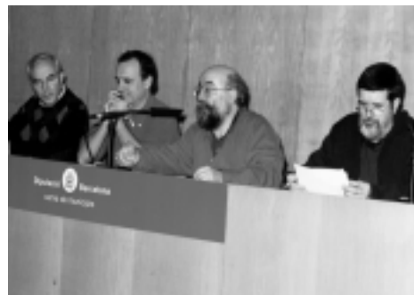
Acte de la Plataforma per les llibertats: No a la Constitució espanyola. No a la constitució europea. BCN 4/12/03

La nostra voluntat és la d'impulsar aquest moviment i que també serveixi per a ajudar en el procés de reagrupament. Per nosaltres una de les seves concrecions seria que també poguéssim tenir una expressió electoral en les eleccions europees.