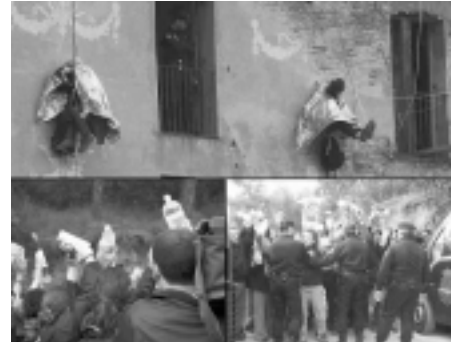
Un altre desallotjament històric: Canmasdéu

Cal continuar la lluita, cal organitzar-se, cal defensar la Hamsa i altres locals, cal combatre el Fòrum... però també cal reflexionar sobre quina és la via per acabar amb el sistema capitalista, per unir tots els sectors oprimits de la població, per impulsar una acció política que eviti els paranys reformistes amb els quals s'intenta