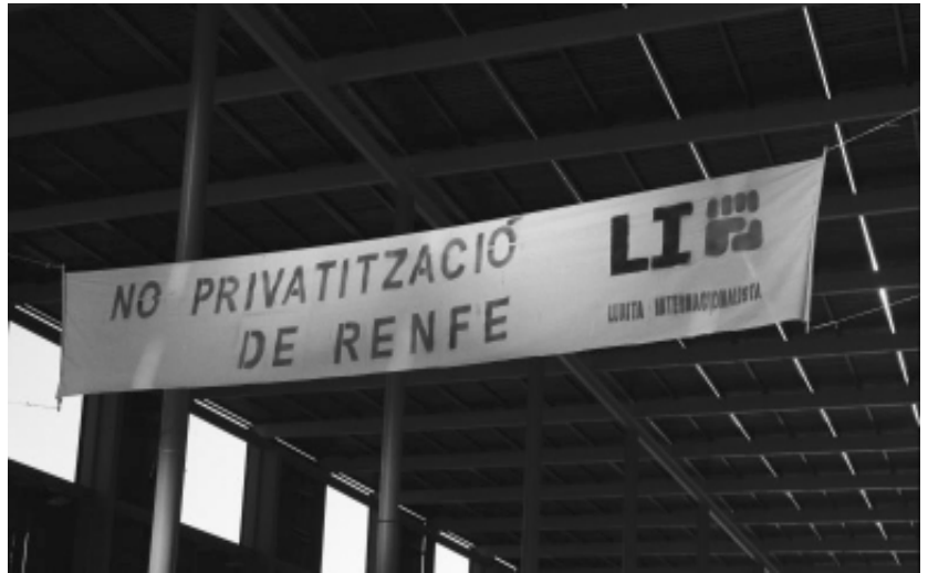
Pancarta penjada al davant de l'Estació de Sants (Barcelona)

L'assemblea estatal de circulació es reuneix a Madrid el 17 de novembre, aprova continuar amb el calendari de vaga, denuncia l'atac que suposa l'expedient contra els companys mentre que "atempta contra el dret de reunió i