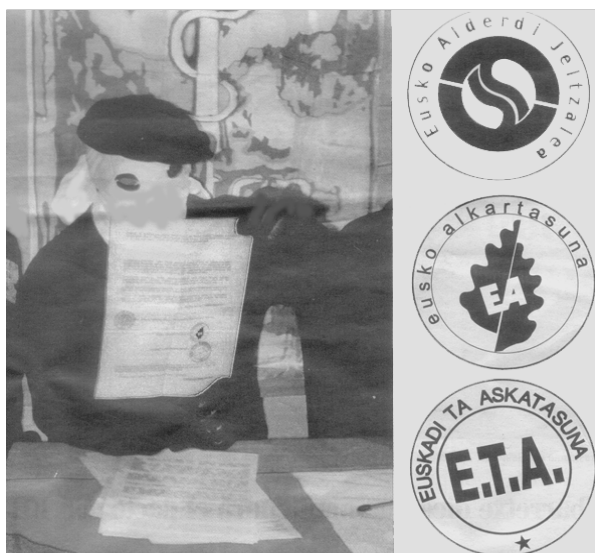
Representant d'ETA ensenyant el pacte signat amb PNV i EA. A la dreta, els tres segells que apareixen en el document. El Mundo 29/11/99

però el que és decisiu de Lizarra era el camí per aconseguir-ho, que encallava qualsevol procés de sobirania nacional. Per això ens vam desmarcar de Lizarra, un pacte que a més sotmetia no tansols HB sinó també la majoria del moviment obrer basc i els seus sindicats, amb moltes organitzacions, a la burgesia basca, representada pel PNV, una qüestió no pas menor que va traduir-se després, el 18 de maig del 99, en el Pacte de Legislatura i que debilita la resposta obrera i popular davant de la política antisocial que fa el Govern del PNV.