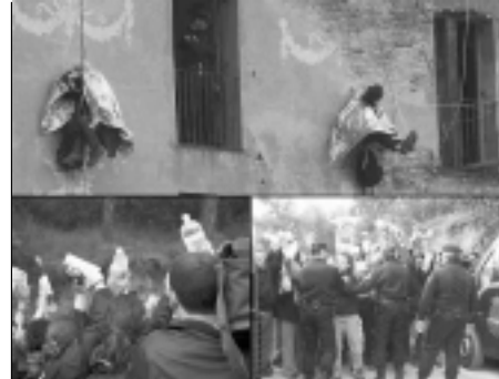
Otro desalojo histórico: Canmasdeu.

Es necesario continuar la lucha, organizarse, defender La Hamsa y otros locales, combatir el Forum... pero también es necesario reflexionar sobre cuál es la vía para terminar con el sistema capitalista, para unir todos los sectores oprimidos de la población, para impulsar una acción política que evite las celadas reformistas con las que se intenta