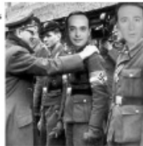
Alfredo Urdaci y Matías Prats, en las Juventudes Socialistas.

Tras descubrir estos aspectos de su pasado se ha mostrado confiado en seguir como jefe de informativos. "Lo importante para mi cargo no es ser de izquierdas o de derechas, la principal cualidad de un buen periodista del ente público es ser dócil , y les aseguro que será difícil encontrar un tipo más dócil que yo".