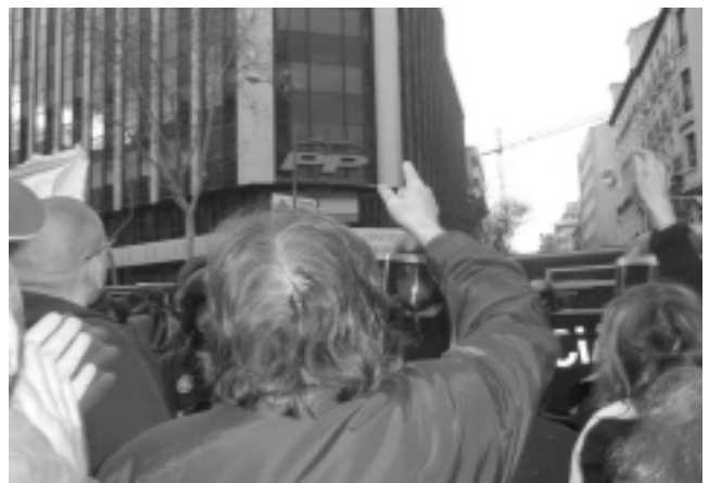
Madrid. Movilización ante la sede PP en la calle Génova. 13/03/04.

Fueron estas manifestaciones quienes causaron el vuelco de los resultados electorales, y no por la coyuntura del atentado –como insinúa ya el PP– sino por el hartazgo. Había que derrocar a Aznar, aunque fuera el último día. Y así lo hicimos. El mensaje es claro para los que ahora le suceden: estáis en el gobierno porque nosotros les hemos echado y no vamos a permitir que juguéis más con nuestras vidas.