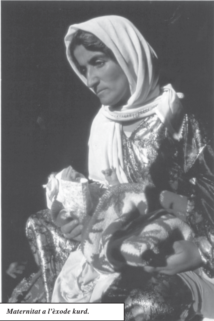
Maternitat a l'èxode kurd.

Freud diu que la superació del Complex d'Èdip és diferent en el mascle que en la femella. Pel que fa