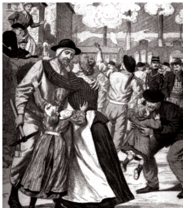
Fi d'una vaga minera. França 1902.

També als Estats Units va formar-se la Women's Trade League (1.903) , que reunia diverses associacions obreres femenines a nivell nacional. Tanmateix, la proximitat de les lluites i la coincidència de les reivindicacions va fer que el sindicalisme femení fos finalment xuclat pel moviment obrer, a partir de la tendència a incorporar-se les dones en els sindicats masculins, però sempre en menor nombre i essent les seves reivindicacions específiques relegades a un segon pla.