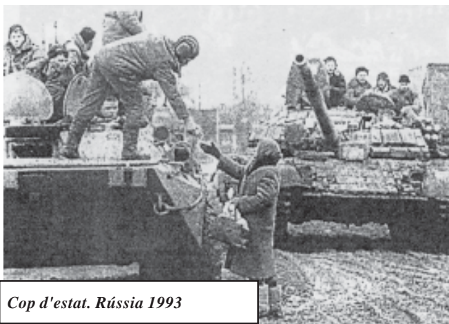
Cop d'estat. Rússia 1993

4. Què significa dir que els papers femenins i masculins són una qüestió cultural?