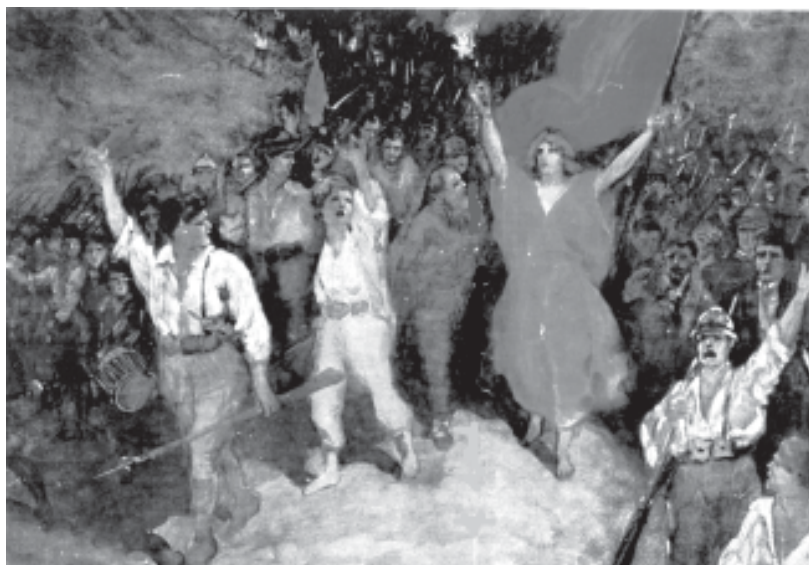
Alegoria de la Internacional Comunista (1919)

Units va realitzar el 1.910 un Congrés Socialista Internacional de la Dona que va resoldre convocar un dia de lluita pel vot femení, el tema del qual era: “El vot per a la dona unirà la nostra força en la lluita pel socialisme” . A Alemanya i a Austria van formar-se comitès, van publicar-se periòdics i van