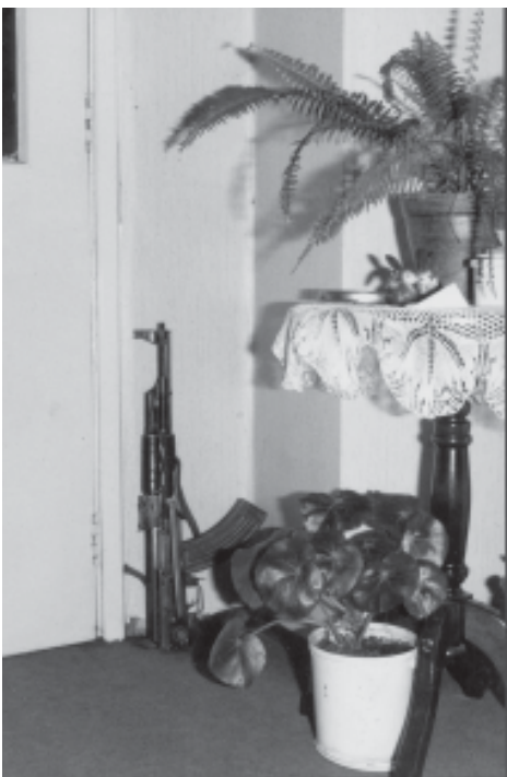
Mestressa de casa?. Konjic (Bòsnia) 1994

"S'ignora quina és la veritable naturalesa femenina, així com tampoc no se sap gaire sobre quina és la veritable naturalesa masculina. Entre els papers socials oferts a les nenes i als nens des del seu naixement, alguns són desiguals i clarament favorables al nen; però ningú no nega que hi ha nens poc engrescats amb la perspectiva d'haver de portar, més endavant, sobre les espatlles la responsabilitat d'una família i totes les càrregues que això implica" (...) "L'exaltació dels valors anomenats "virils", acompanyats d'agressivitat, de competència i l'obligació permanent que se'ls imposa d'afirmar-se, de vèncer proves, implica també un aspecte angoixant que no combina amb la mateixa naturalesa de l'home. La crisi d'identitat de la dona, si apareix avui amb evidència, no ha de fer-nos oblidar que existeix la de l'altre sexe que,