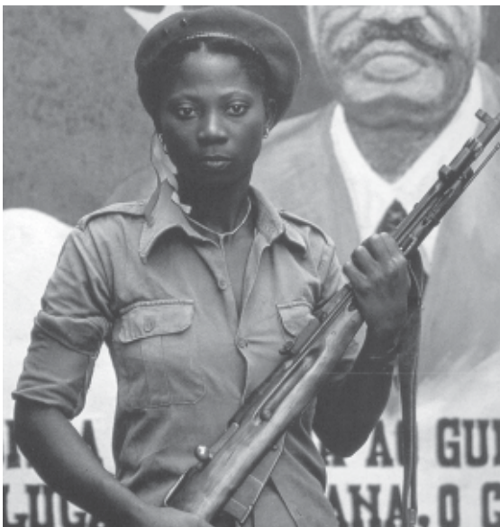
Naturalesa femenina? Combatent del MPLA. Angola 1975

En les tribus nòmades era cada un per sí mateix, en les agrícoles la dona passa a ser valorada com a reproductora, però res no indica que estava controlada per l'home. Tot fa pensar al contrari: que ella mateixa controlava la seva fertilitat. La dona pot tenir entre