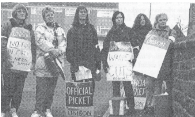
Gran Bretanya: en lluita pel treball i els serveis públics (atenció a la tercera edat)

Els empresaris estan constatant que si treballa a casa la dona té un rendiment més gran. I no els cal instal·lar ni pagar guarderia, ni ajuda per maternitat ni d'altres drets. Per als treballadors efectius també aquests drets mínims es veuen amenaçats. Al Brasil, el dret a la llicència per maternitat de 4 mesos, temps considerat suficient per tal que la dona alletí segons la Constitució del 88, està essent qüestionat poc a poc, no tant pels guanys empresarials, sinó sobretot per una altra cosa més estructural, és a dir, la crisi econòmica i la por de la dona a quedar-se tant de temps fora de l'empresa i de que al tornar ja no trobi el seu treball.