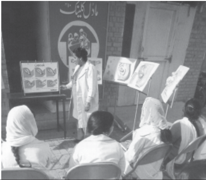
Lahore (Pakistan). Planificació familiar

Per ser religiós, i per tant considerar la religió com la palanca principal de la història, l'explicació de Bachofen dóna a la transició d'aquest període de promiscuitat cap a la monogàmia i del dret matern cap