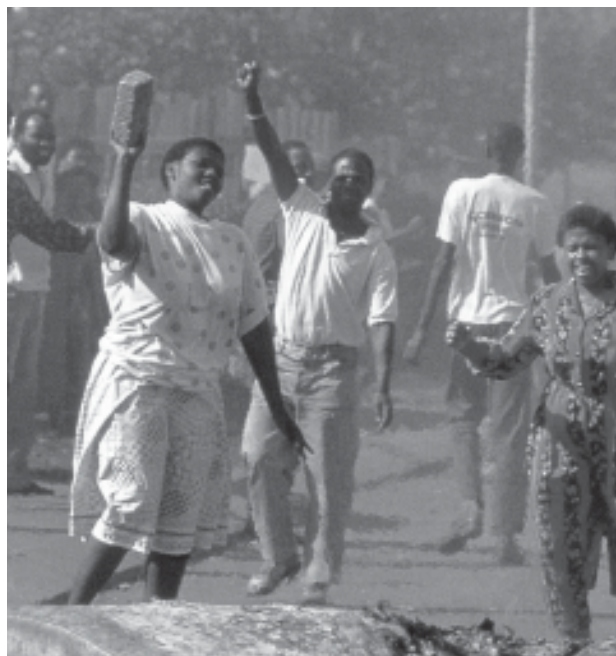
Soweto (Sudàfrica). En lluita contra l'apartheid.

Aquesta major participació femenina, no només