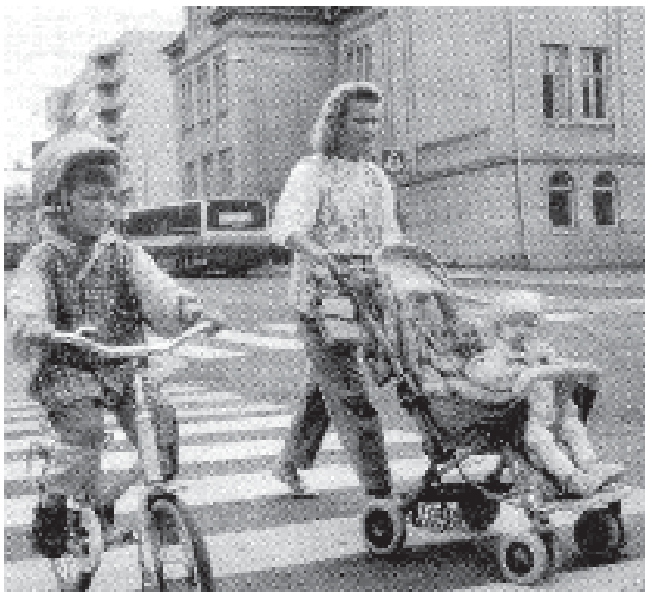
De l'escola bressol a la feina. Finlàndia. 1997

Segons Freud, la nena renuncia a la sexualitat clitoriana perquè aquesta és masculina, com si el clítoris fos, biològicament i psicològicament, el representant del penis.