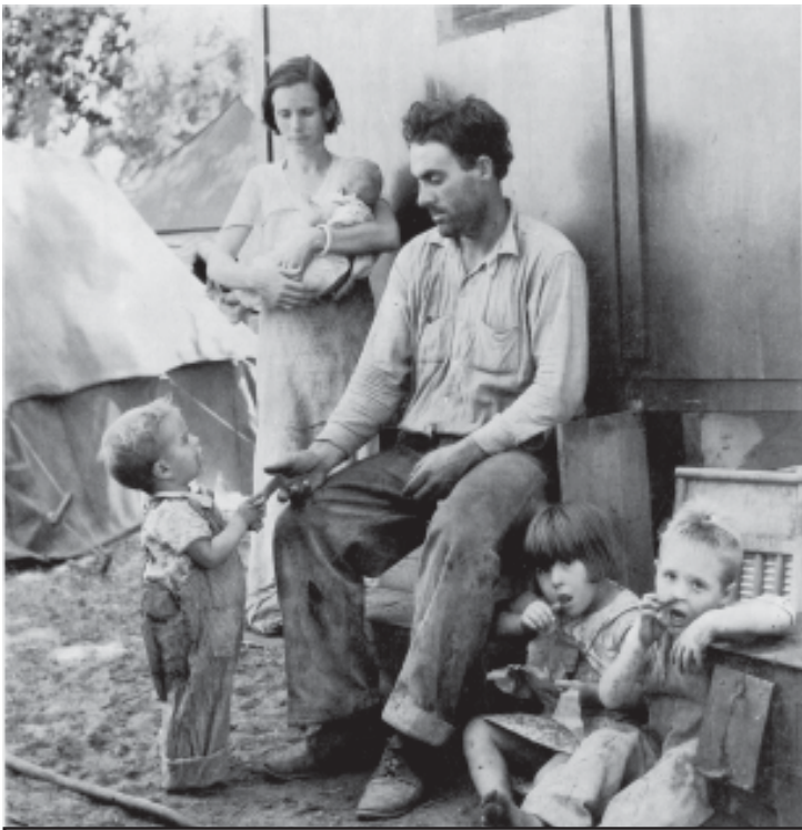
La Gran Depressió. Tennessee (USA)

“Aquesta teorització -diu Ferro- va tenir una inserció tant potent a la cultura occidental que, de fet, popularment el terme que marca l'oposició a home és el de mare , perquè l'home és home, però la dona és totalment dona quan és mare (...). El concepte de mare és sense cap dubte més restrictiu que el concepte de dona. Dona implica una pluralitat de funcions que inclou la funció de mare, mentre que el fet de definir-la com a mare limita funcionalment qualsevol altra possible