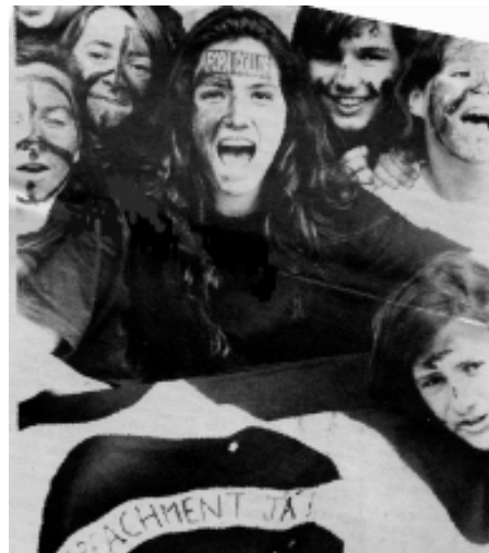
Brasil. Mobilitzacions contra Collor