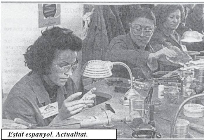
Estat espanyol. Actualitat.

Aquest canvi en l'estructura productiva i en el mercat de treball va possibilitar també la incorporació i l'augment de l'explotació de la força de treball de les dones en ocupacions a temps parcial, en feines "domèstiques" subordinades al capital. Antunes dóna l'exemple de la fàbrica Benetton i diu que a Itàlia aproximadament un milió de llocs de treball creats en