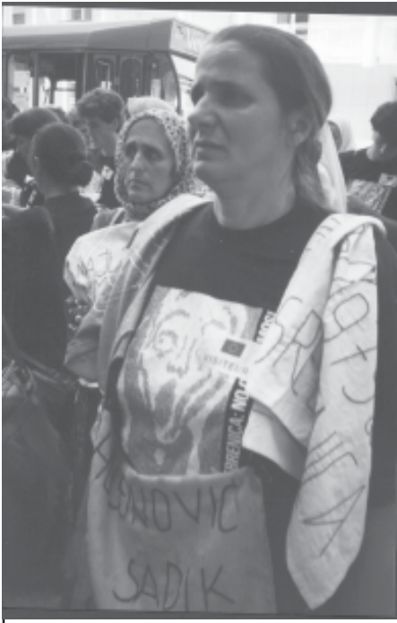
Dones de Srebrenica (Bòsnia). 1996 En lluita pels seus "desapareguts".

materials de vida allò que constitueix la consciència, el que construeix i manté les superestructures ideològiques, sabem que per modificar la consciència cal abans que res canviar les condicions materials de vida.