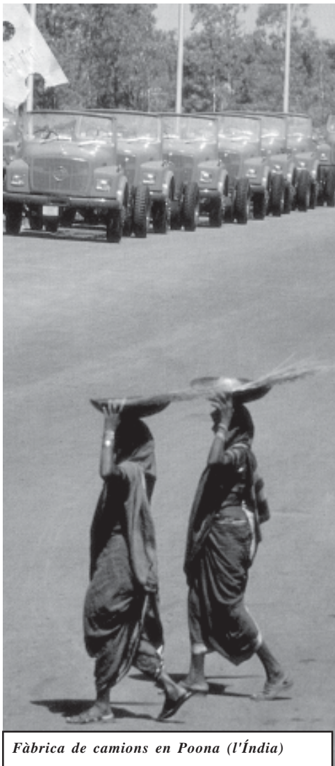
Fàbrica de camions en Poona (l'Índia)

D'aquesta forma, amb la substitució cada cop més intensa del treball masculí pel treball femení i sobre tot, amb la substitució del treball dels adults pel treball infantil, va augmentar molt el nombre d'obers i el capital va aconseguir reduir el nivell salarial de tots ells. Com recorda Marx, “tres nenes de 13 anys, amb salaris de 6 a 8 xílings per setmana, substitueixen un home d'edat madura amb una jornada de 18 a 45 xílings”.