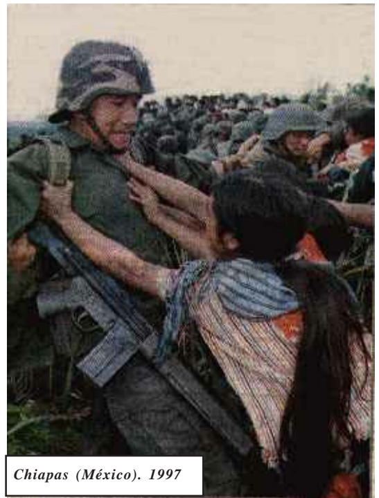
Chiapas (Mèxic). 1997

SCUM , que en anglès vol dir "escòria". Aquesta organització cridava simplement, Society for the Cutting Up of Men (Societat per triturar els homes)... o més agressius, com el WITCH , que en anglès vol dir "bruixa". El WITCH era la Women's International Terrorist Cons-