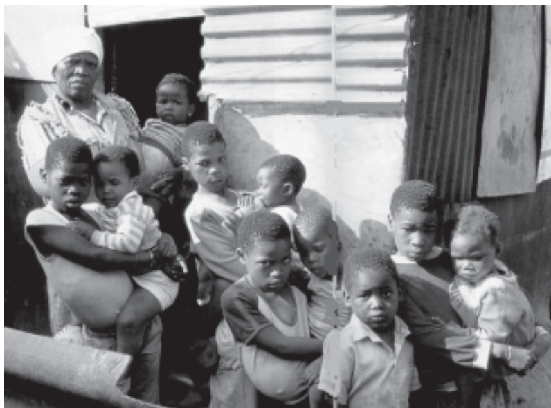
Mare a Soweto (Sudàfrica)

Per elles, la definició del sexe com a quelcom de repugnant és vàlida tant per homes com per dones i determina l'enemic sexual contra el qual tots dos havien de lluitar. Però les recomanacions dels pares de l'Església pel que fa a la conducció d'una vida ascètica no eren pas les mateixes per als homes que