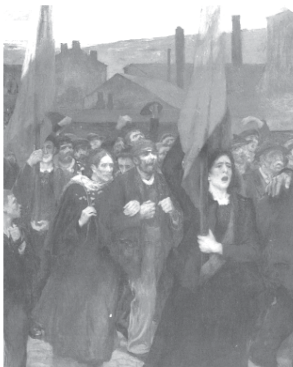
Octubre 1917. Rússia

per les diverses tendències polítiques. Tant els bolxevics com els menxevics tenien periòdics especials per a la dona treballadora, com ara el "Rabotnitsa", publicat pels bolxevics i el "Golos rabotnitsy", pels menxevics. Els socialrevolucionaris (SR), que lluitaven per la democràcia burgesa a Rússia, al temps, van proposar la creació de la "unió de les organitzacions democràtiques de dones", que uniria els sindicats i els partits sota la bandera d'una república democràtica. I va ser llavors que va sortir la Lliga per Drets Iguals per a la Dona, exigint el dret de vot per a les dones, acompanyant la batalla que trabaven en el món sencer pels seus drets civils.