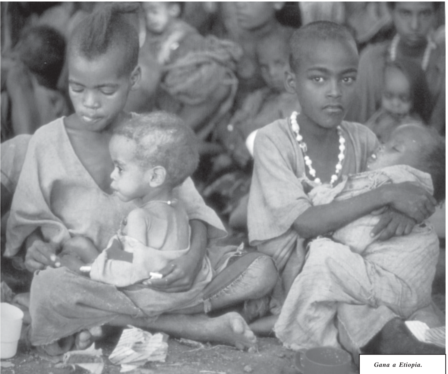
Gana a Etiòpia.

Segons Freud, el complex nuclear de totes les neurosis que les persones creen és el que va batejar com a Complex d'Èdip, inspirant-se en l'obra “Èdip Rei”, de Sòfocles. L'infant pren el pares, i en concret un d'ells, com l'objecte dels seus desitjos eròtics. La nena generalment pren el pare i el nen la mare. És un sentiment destinat a una ràpida repressió i que queda