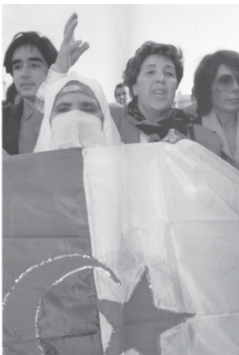
Algèria: entre dos mons

musulmans amb no musulmans, l'Alcorà imposa les mateixes regles per a ambdós sexes, però la llei només actua contra dones. A l'Àrabia Saudita, per exemple, molts homes es casen amb cristianes, però les dones saudites tenen rigorosament prohibit casar-se amb no musulmans. Mantenen relacions sexuals