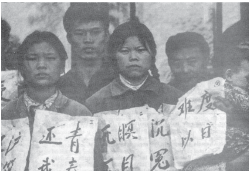
Sanghai: en lluita pel treball.

pel món sencer. Després de llargs anys de submissió, més i més dones nordamericanes, sobretot de classe mitjana, començaren a despertar i a unir-se als negres en la lluita pels seus drets, i als estudiants. Aquesta avantguarda feminista lluitava per tal que la dona deixés de ser considerada com a “segon sexe”. Malgrat haver-se iniciat a la petita burgesia, que va ser la seva direcció pràcticament tot el temps, el moviment feminista va posar contra les cordes els pilars més sagrats del capitalisme i de la societat burgesa. Fou una lluita internacional, que va qüestionar des de la discriminació de la dona en el treball i els prejudicis arrelats feia milenys, fins les lleis reaccionàries que prohibien l'avortament i els conceptes retrògrads de l'Església.