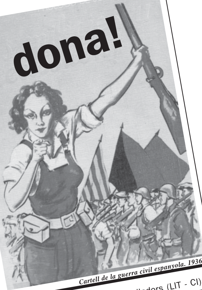
Cartell de la guerra civil espanyola. 1936