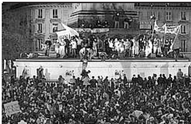
Movilizaciones contra Le Pen tras las elecciones.

1 GSI Grup Socialista Internacionalista, secció de la Lliga Internacional de Treballadors (LIT-ci) a França.