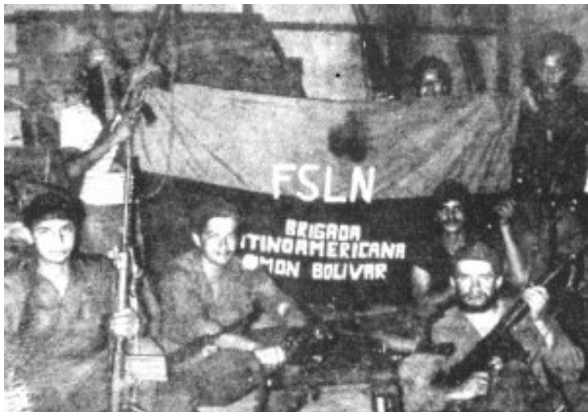
Combatientes de la Brigada en el frente Sur. Julio de 1979

En aquel momento, para la izquierda latinoamericana nuestra postura era considerada sectaria. Muchos, incluso en las filas del trotskismo “justificaban” nuestra expulsión, diciendo que nuestra posición era “exagerada”,