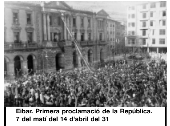
Eibar. Primera proclamació de la República. 7 del matí del 14 d'abril del 31

El nou Govern, presidit per l'Almirall Aznar, va tornar a obrir les Universitats i va convocar eleccions municipals per al 12 d'abril,