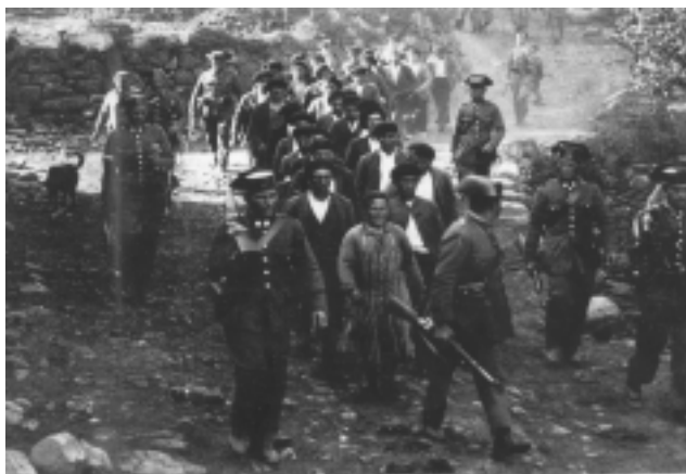
Octubre 34: repressió de la insurrecció asturiana.

(...) el proletariat té necessitat des d'ara d'una organització que s'aixequi per sobre de totes les divisions polítiques, nacionals, provincials i