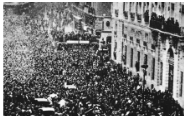
Madrid. Proclamació de la II República. 14/4/31