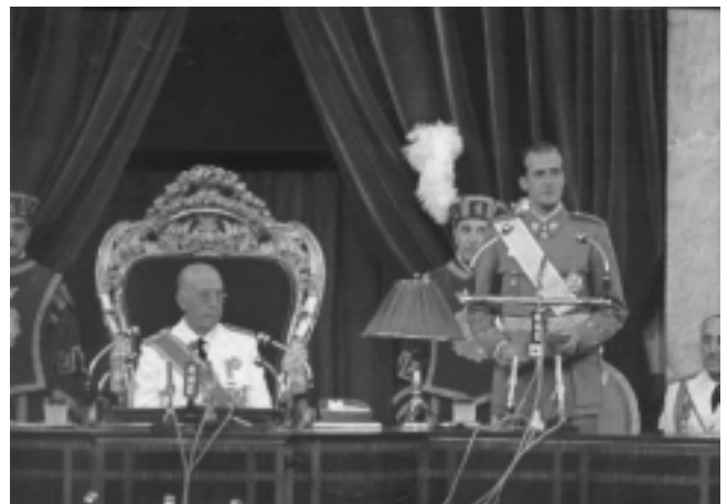
1969. Franco designa sucesor a Juan Carlos a les Corts

El PCE, en la transició, va ser el primer a reconèixer la bandera monàrquic-franquista. Més tard, amb Izquierda Unida, va intentar escapar al fracàs de l'estalinisme, però no va fer sinó seguir el rastre de la socialdemocràcia, acollint-se a totes aquelles mesures de Reforma del capitalisme que, per impossibles, el PSOE anava desestimant en la seva labor de Govern, i com no! defensant la Constitució i volent ser més monàrquic que ningú. El vam trobar primer en el Pacte de Ajuria Enea en suport de la repressió, més tard abstenint-se a la il·legalització de Batasuna o recolzant el front «anti-