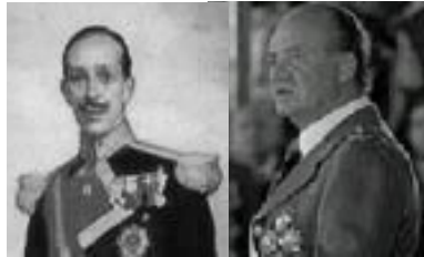
Avui com ahir: avi i nét

Les classes dirigents van ser sempre incapaces de governar en el seu propi nom.