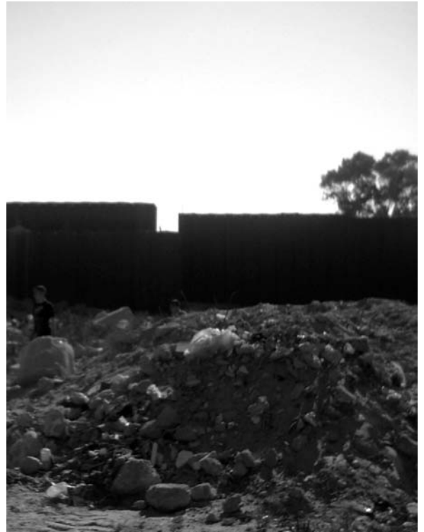
Muro que separa Gaza y Egipto, en Rafah

El escaso interés de los medios de comunicación y la falta de movilizaciones de este verano contrastan con la gravedad de lo que se está viviendo en Gaza. Desde que el 14 de junio Hamas tomó el control de la franja, decenas de palestinos han sido asesinados en ataques de la aviación y la artillería israelíes, mientras el bloqueo político y económico ha generado niveles de miseria sin precedentes. Abu Mazen -tras haber impuesto un gobierno de excepción para usurpar el poder ganado por Hamas en las urnas- aparece claramente como el agente de Israel y del imperialismo en los territorios palestinos, y el aislamiento de Gaza del resto del pueblo palestino es hoy una política concertada en Israel. El movimiento internacional de apoyo a Palestina está golpeado por la confusión y la falta de perspectivas, los sectores de la diáspora próximos a Fatah callan, y el silencio impuesto desde el gobierno por el PSOE y sus aliados (desde IU hasta ERC y las burocracias sindicales) dificultan la organización de una respuesta. Con esta difícil situación hay que multiplicar los esfuerzos para organizar este año las movilizaciones del 28 de septiembre, aniversario de la Segunda Intifada, con un grito: abajo el bloqueo de Gaza!