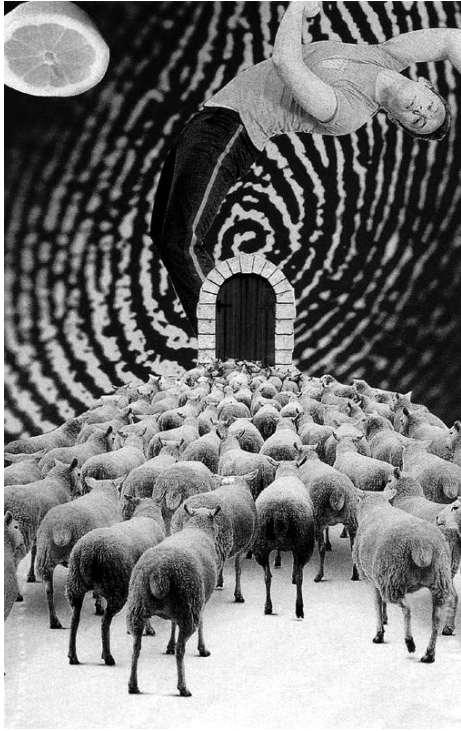
El fin del estalinismo (collage, 1998)