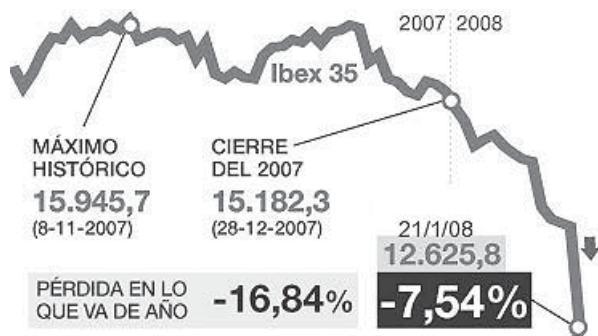
Caída del IBOEX 35, el 21 de enero