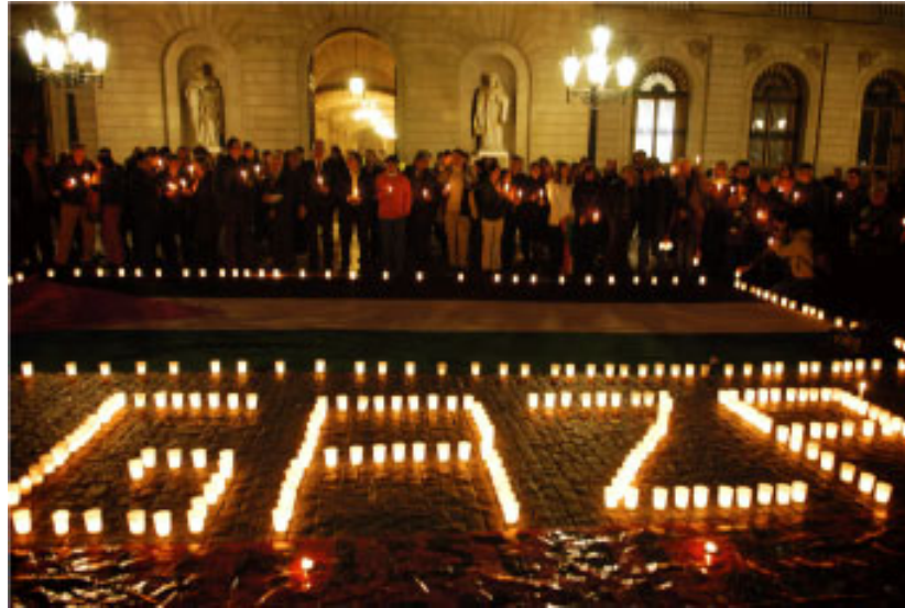
Manifestación de apoyo a Gaza en Barcelona, 24/1/08

Que la política reaccionaria de Hamas imposibilitaba un enfrentamiento victorioso con el imperialismo tampoco era novedad. Mientras estábamos allí nos comentaban con rabia la represión que sufrían –y cosa importante las perspectivas de una movilización coordinada con Cisjordania para denunciar la represión que unos bajo Hamas y los otros bajo la ANP estaban sufriendo-, y del miedo que se tenía cuando oían volar un qasan, buena parte de los cuales caen en territorio palestino –de dos que vimos, uno cayó sin cruzar la frontera- y además justifican la siguiente incursión –en esos días