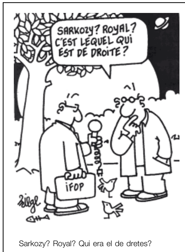
Sarkozy? Royal? Qui era el de dretes?

partidària de la "democràcia fins al final", ha renunciat a la dictadura del proletariat i al centralisme democràtic. També la LCR fa així en totes les seves campanyes en "l'Europa social" i la regionalització, sense exigir mai l'anul·lació dels tractats capitalistes europeus. Però precisament són aquests tractats els que encarnen plenament el conjunt dels atacs econòmics i socials dirigits contra els treballadors, a França i a Europa.