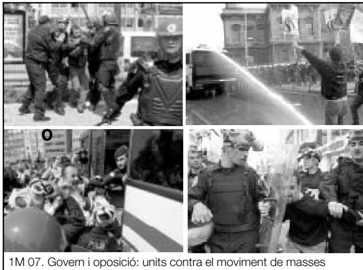
1M 07. Govern i oposició: units contra el moviment de masses

7. L'oposició de quatre anys de la socialdemocràcia no s'ha dedicat a els atacs econòmics i socials del govern demo-musulmà contra la classe treballadora i el poble, sinó a difondre la por al fonamentalisme entre la població laica, buscant el seu futur polític en la intervenció dels militars. Ha saludat la declaració de l'Estat Major del 27 d'abril, i ha aplaudit la intervenció bonapartista. No ha defensat el Parlament davant els militars; enlloc d'això, ha facilitat la seva destrucció per mitjà de la resolució del Tribunal