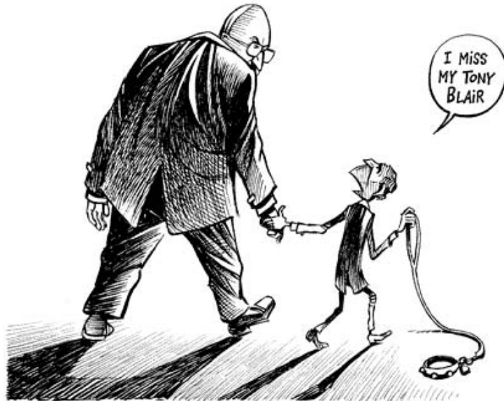
-He perdut el meu Tony Blair

pakistanesa i a l'oligarquia governant a Aràbia Saudita." Però no ha dit res sobre el rol actual de l'ONU ni el seu paper d'ajudar a augmentar la fam al poble iraquí amb les seves sancions en la dècada de 1990, ni en l'ajuda en preparar el camí per a la invasió