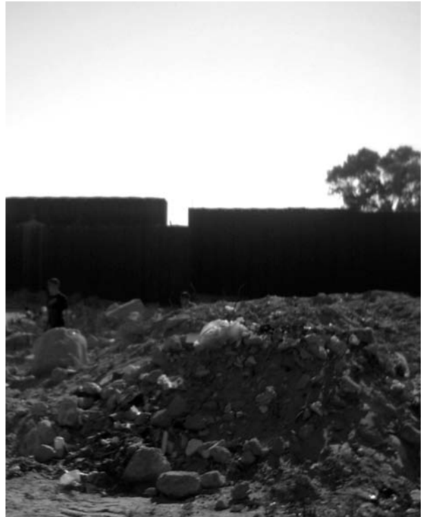
Mur que separa Gaza i Egipte, a Rafah

L'escàs interès dels mitjans de comunicació i la manca de mobilitzacions d'aquest estiu contrasten amb la gravetat del que s'està vivint a Gaza. Des que el 14 de juny Hamàs va prendre el control de la franja, desenes de palestins han estat assassinats en atacs de l'aviació i l'artilleria israelianes, mentre el bloqueig polític i econòmic ha generat nivells de misèria sense precedents. Abu Mazen -després d'haver imposat un govern d'excepció per usurpar el poder guanyat per Hamas a les urnes- apareix clarament com l'agent d'Israel i de l'imperialisme a l'interior dels territoris palestins i l'aïllament de Gaza de la rest del poble palestí és avui una política concertada amb Israel. El moviment internacional de suport a Palestina està colpejat per la confusió i la manca de perspectives, els sectors de la diàspora propers a Fatah callen, i el silenci imposat des del govern pel PSOE i els seus aliats (des d'IU fins a ERC i les burocràcies sindicals) dificulten l'organització d'una resposta. Amb aquesta difícil situació cal multiplicar els esforços per organitzar les mobilitzacions del 28 de setembre, aniversari de la Segona Intifada, aquest any amb un crit: fora el bloqueig de Gaza!