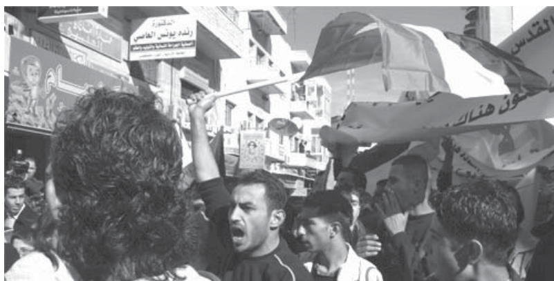
La manifestació de Ramallah contra la cimera d'Annapolis del passat 28 de novembre va ser durament reprimida per la policia palestina.

“Israelians i palestins decideixen a Annapolis relançar el procés de pau”. Aquest era el titular del passat 26 de novembre, sobre l'inici de la conferència en què Israel, l'Autoritat Palestina, 16 règims àrabs i els representants de la UE corrien a aplicar amb bona lletra els dictats de Bush. L'enèssima trobada internacional (més d'un quart de segle després de la Conferència de Madrid que va donar lloc als acords d'Oslo) en què es parla de posar les bases per a la creació d'un estat palestí al costat d'Israel. Però el titular s'escribia aquesta vegada amb lletra petita, perquè aquesta utopia ja no té cap credibilitat.