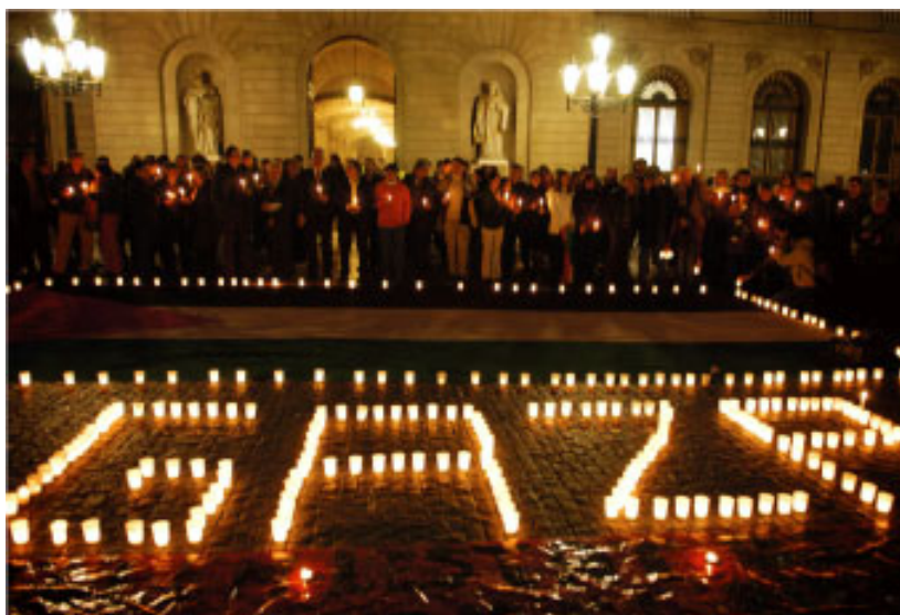
Manifestació de suport a Gaza a Barcelona, 24/1/08

Que la política reaccionària de Hamas impossibilitava un enfrontament victoriós amb l'imperialisme tampoc era novetat. Mentre érem allà ens comentaven amb ràbia la repressió que sofrien: els companys de la UICOP treballaven en una mobilització coordinada amb Cisjordània per denunciar la repressió que, uns sota Hamas i els altres sota l'ANP, estaven patint. També ens parlaven de la por que tenien quan sentien volar un Qassam, perquè bona part d'ells acaben caient en territori