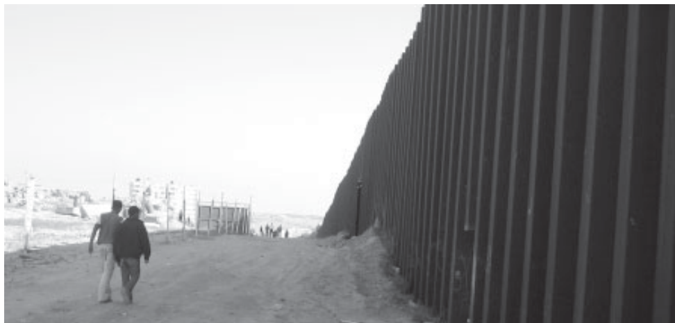
Frontera de Rafah

Això ens deïen a Ramallah. I hi afegien, “una Intifada molt gran, com la primera”. Israel segueix guanyant temps per “acabar” amb dos “problemes”: el de Jerusalem i el dels refugiats. Així, mentre segueix construint barris a Jerusalem per jueus i reafirmant-se que és innegociable, redueix els ja escassos drets dels palestins residents a la ciutat, alhora que els grava amb càrregues impositives impossibles de pagar que pressionin per reduir la població àrab. Alhora Israel està buscant una “solució” per als refugiats que hi ha tant en altres països com a la pròpia Palestina, a força d'oferir diners per establir-se fora, juntament amb el canvi del passaport i amb ell de nacionalitat. Però si bé això podria quallar en aquells emigrants que porten anys a l'exterior i que podrien entrar en el joc, està rebent negatives per part dels que resideixen als camps de l'interior, i afegeix un element més de tensió.