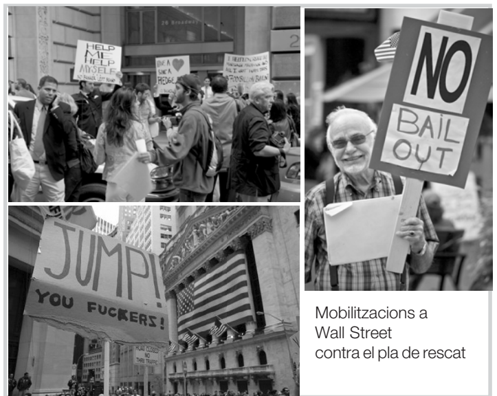
Mobilitzacions a Wall Street contra el pla de rescat

Extractes de l'entrevista de Patricia Rivas al Web YVKE. 29/09/08.