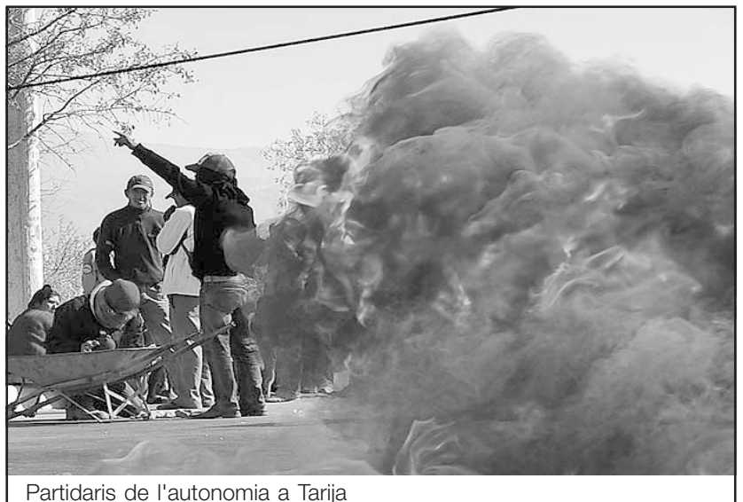
Partidaris de l'autonomia a Tarija

Després del referèndum revocatori de l'agost passat, en el qual Evo Morales va obtenir prop del 70% de suport, l'ofensiva de la burgesia i l'extrema dreta es va intensificar, combinant-la amb ocupacions d'instal·lacions petrolieres i del gas, peatges, oficines de recaptació del govern, talls de carreteres i assalts a emissores de ràdio i televisió no controlades pels prefectes i la