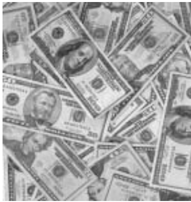
Una maneta de pintura i com nou!