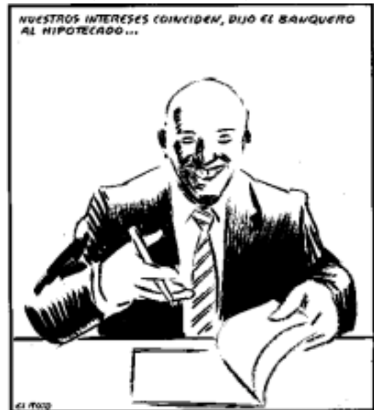
Els nostres interessos coincideixen, va dir el banquer a l'hipotecat