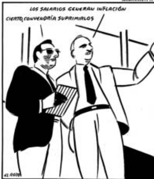
Els salaris generen inflació Cert, caldria suprimir-los