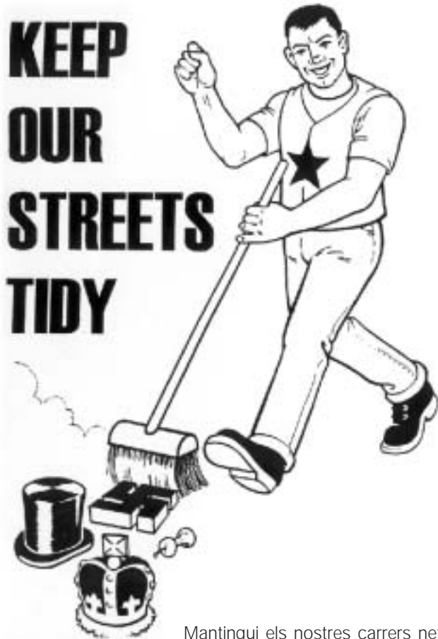
Mantingui els nostres carrers nets