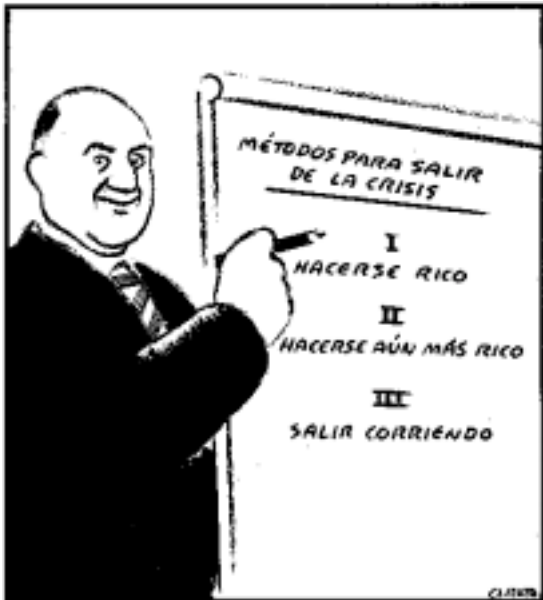
Mètodes per sortir de la crisi. I. Fer-se ric; II fer-se encara més ric; III sortir corrent