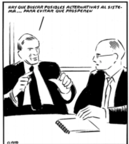
Cal buscar possibles alternatives al sistema... per evitar que prosperin