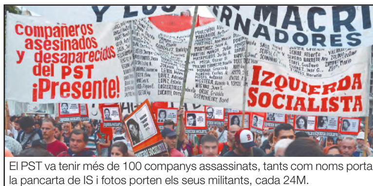
El PST va tenir més de 100 companys assassinats, tants com noms porta la pancarta de IS i fotos porten els seus militants, cada 24M.

Avui, des d'Izquierda Socialista continuem el camí del gloriós PST, (...)