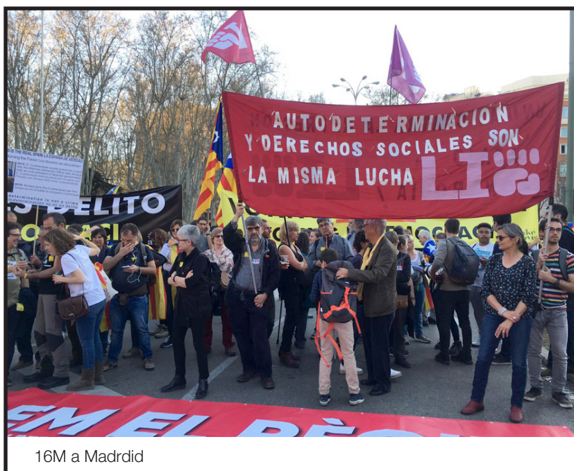
16M a Madrid

La crisi econòmica de 2008/2009 va desencadenar una batalla interburguesa pel control d'uns excedents cada vegada més escassos. La burgesia central amb el suport de l'aparell de l'estat va iniciar profundes recentralitzacions polítiques i econòmiques. Això va portar al fet que un sector de la burgesia, primer basca i després catalana, entressin en un seriós conflicte. És al caliu d'aquest xoc que les reivindicacions democràtiques d'un ampli sector del