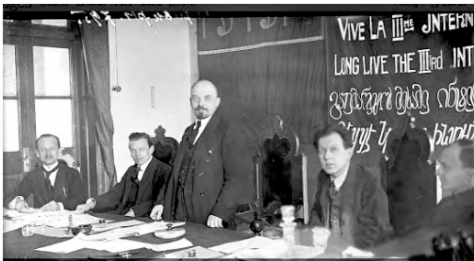
El 2 de març de 1919 es va fundar la III Internacional. A la foto, Lenin en una de les sessions

Mentrestant, les velles direccions dels partits socialdemòcrates de tots els països europeus, agrupades en la II Internacional, entraven en crisi per haver donat suport cada un al seu govern en la guerra imperialista. I, acabada la guerra, per traïr les revolucions que esclataren en diversos països d'Europa Central, sent el cas més destacat l'alemany, on la socialdemocràcia va ser còmplice de l'assassinat de Karl Liebknecht i Rosa Luxemburg. A causa de tot això, milions de treballadores i treballadors, de joves, de tots els sectors explotats, es