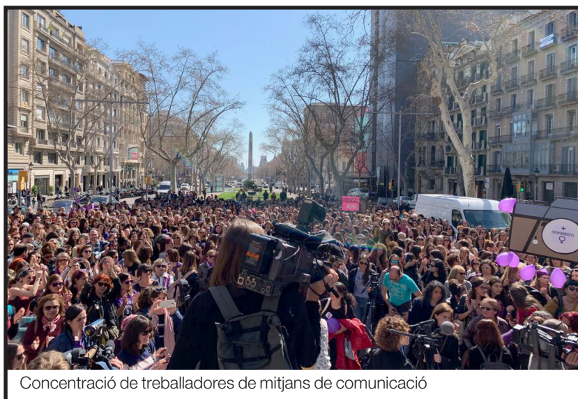
Concentració de treballadores de mitjans de comunicació

xenofòbia institucional. Els crits de «No passaran» i «Ni un pas enrere» s'han fet sentir amb força, en un context d'ascens de l'extrema dreta i de les polítiques reaccionàries.