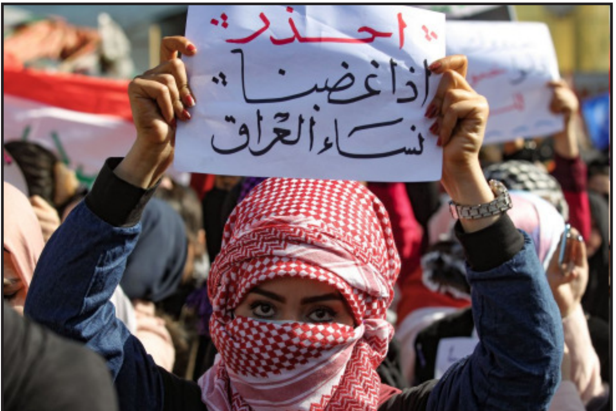
La pancarta diu: "Compte amb la ira de les dones iraquianes". AHMAD AL-RUBAYE (AFP). Bagdad 13/02/2020, El País Internacional.

Un dels moments més complicats va ser l'assassinat per Estats Units de Suleimani, a principis de gener, que les milícies pro-iranians van tractar d'utilitzar per fer callar la denúncia contra el règim i el seu aliat iranià. No obstant això les protestes van seguir, contra els Estats Units i contra Iran.