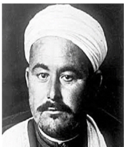
تكریم الزعيم محمد بن عبد الكريم الخطابي

26 de setembre de 2020. 18.30h Plaça Pepet Pol d'Arbúcies, La Selva, Girona.