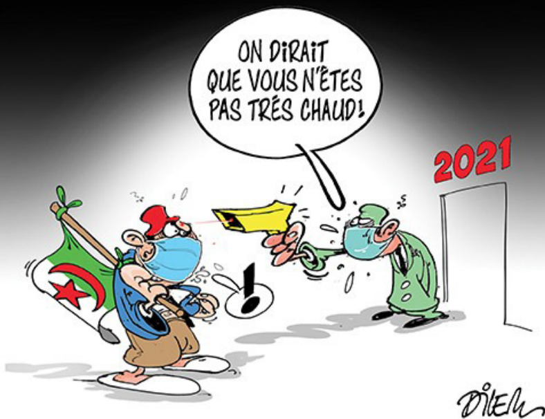
Vinyeta del dibuixant algerià Diem, on es llegeix: «Els algerians s'afanyen a començar el 2021. Sembla que no esteu gaire calents».

complexa. Un procés contradictori en què la dialèctica entre la revolució i la contrarevolució encara no ha dit l'última paraula.