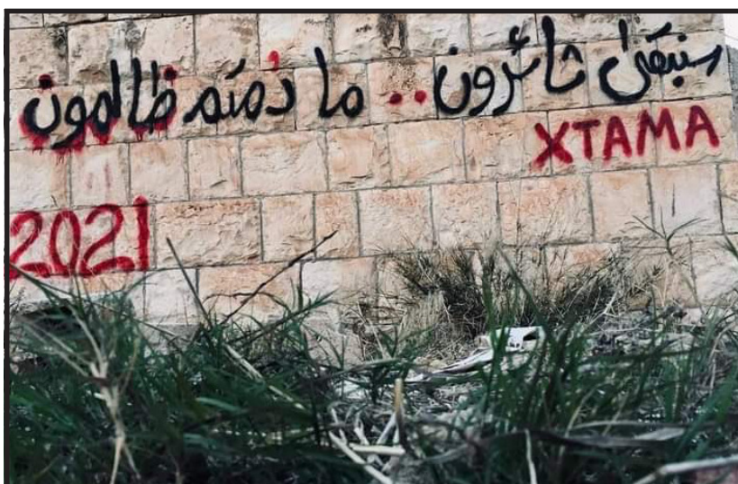
A Daraa (el poble de Síria on va començar la revolució aviat farà 10 anys) a la pintada diu: «Mentre hi hagi dictadors, nosaltres serem revolucionaris. Que el 2021 ens porti coses bones.»

ta. I tampoc «l'hivern islamista» va ser el final. L'onada revolucionària que va començar a Tunísia el desembre de 2010 va ser l'inici d'un tsunami social i polític i té una ona expansiva llarga,