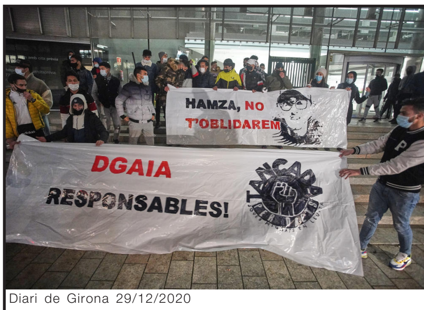
Diari de Girona 29/12/2020