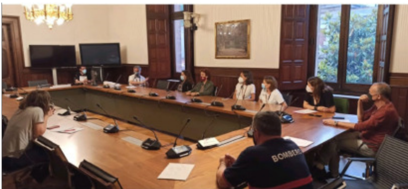
El 04/06/2021, les subcontractades de Nissan, Servi Securitas (bombers), Altran, Aubay, SNOP i Tecnove, es van reunir al Parlament amb el grup parlamentari de la CUP-G.

El Govern central havia xifrat en 1.260 milions el cost total de la sortida de Nissan de les tres factories: 600 per acomiadaments, 310 per amortitzacions, 250 per tancar Sant Andreu de la Barca i Montcada i Reixac, 100 més pels