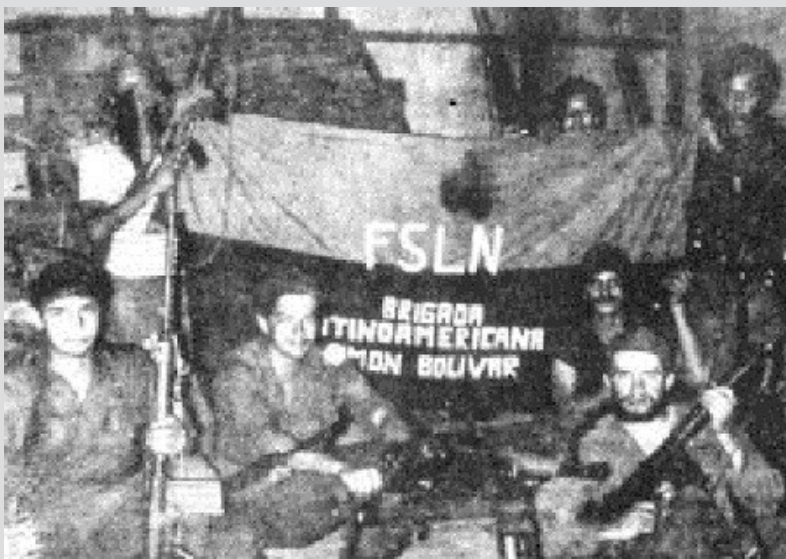
(1) Veure el llibre La Brigada Simón Bolívar . Edicions El Socialista

Allí van ser allotjats en una gran cel·la de la Presó Model (avui ja no existeix) de presos comuns. Va ser directament Noriega –llavors segon del govern panameny de Torrijos- qui va donar l'ordre de traslladar la brigada a la caserna de la Guàrdia Nacional de Tinajistas i donar-li un «càstig». En Tinajistas, membres de la Guàrdia Nacional, van apallissar a cops de culata i pals als integrants de la Simón Bolívar. Finalment, la brigada seria alliberada fruit d'una gran campanya internacional.