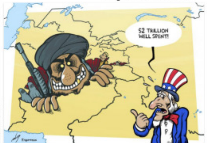
"¡2 trillons de dòlars ben gastats!" Rodrigo de Matos