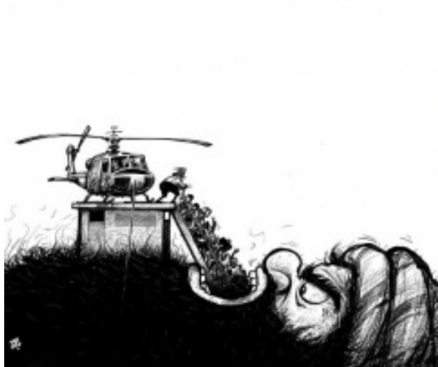
"De Saigon a Kabul" Emad Hajjaj