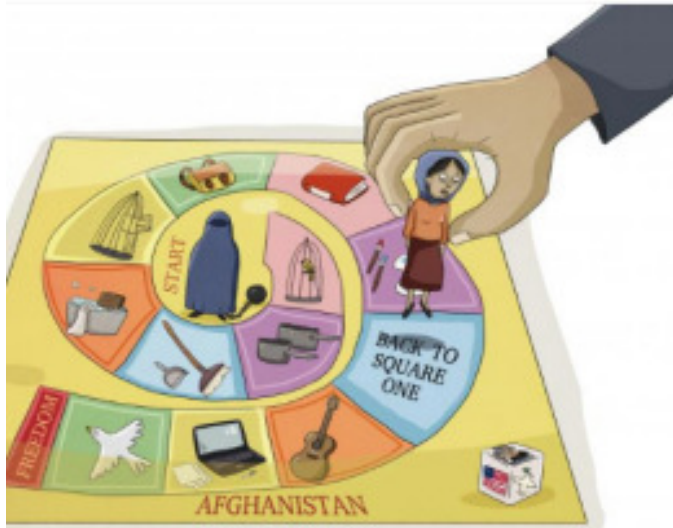
"Retorn a la casella de sortida" Anne Drenne