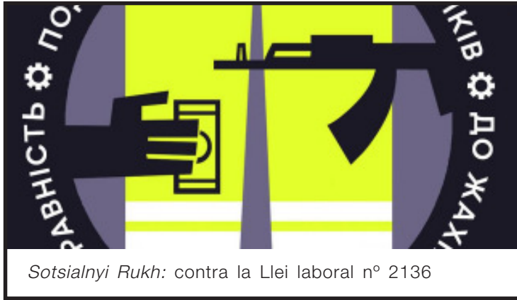
Sotsialnyi Rukh: contra la Llei laboral nº 2136

cable, més que del transport privat i amb bateries. Cal implementar àmpliament els sistemes de calefacció elèctrica, com ara bombes de calor. S'ha de reduir l'ús de la fusta i s'han d'adoptar mesures per protegir els boscos.