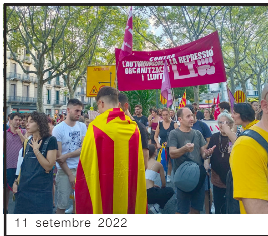
11 setembre 2022

Però l'ANC anava més enllà, amb l'exigència de « O independència o eleccions », i l'amenaça de presentar-se amb una llista cívica, si no s'aprovava una resolució el proper 27 de setembre al debat de política general amb « El compromís de les institucions quant a activar la DI el segon semestre de 2023, pot donar tenir el tret de sortida en una gran mobilització ciutadana l'1 d'octubre de 2022, junt amb les institucions, per tal d'assegurar que la DI tingui lloc i sigui efectiva ».