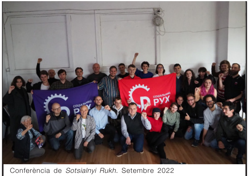
Conferència de Sotsialnyi Rukh. Setembre 2022

tirant endavant legislacions destinades a limitar la seva participació en la presa de decisions, provocant així nous conflictes socials, minant les capacitats de defensa, i atacant els drets democràtics de la majoria per a la protecció de la minoria dominant. [...] Hi va haver un suport generalitzat a la demanda de cancel·lar el deute exterior d'Ucraïna, que va provocar la seva eventual congelació i el suport dels sindicats mundials més grans i dels partits de l'esquerra democràtica. [...] Ara que el país en tota la seva diversitat lingüística, ètnica i cultural s'ha unit per la lluita armada pel dret a decidir sobre el seu propi destí a través de les seves pròpies formes d'autoorganització, [...] és la gent treballadora, qui constitueixen la nació ucraïnesa que ha de decidir com construir el nostre país.