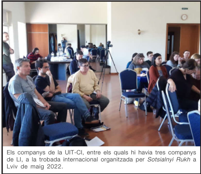
Els companys de la UIT-CI, entre els quals hi havia tres companys de LI, a la trobada internacional organitzada per Sotsialnyi Rukh a Lviv de maig 2022.

A més, el desenvolupament de l'autogovern dels estudiants és fonamental. Els estudiants han d'implicar-se en el procés de presa de decisions a les universitats i altres centres d'estudi, i desenvolupar una xarxa de sindicats d'estudiants