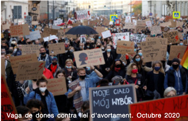
Vaga de dones contra llei d'avortament. Octubre 2020

LI.- Què diries davant dels dubtes que hi ha en part de l'esquerra europea sobre la invasió d'Ucraïna?