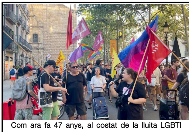
Com ara fa 47 anys, al costat de la lluita LGBTI