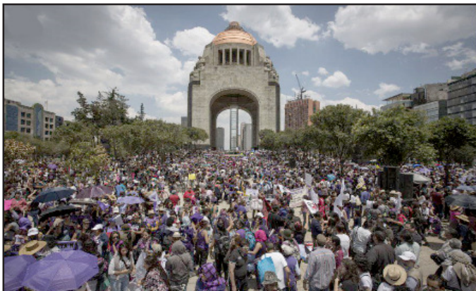
México, 17 agosto 2019

Mercedes de Mendieta. Periódico El Socialista. Argentina