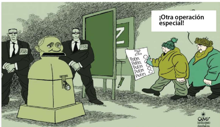
Elecciones en Rusia: victoria asegurada