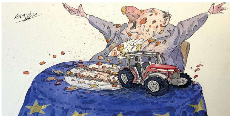
“¡Hay un tractor en mi plato!”