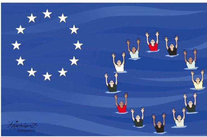
Símbolos en el Mediterraneo