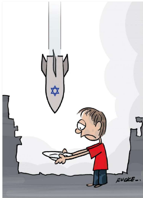
Hambre en Gaza